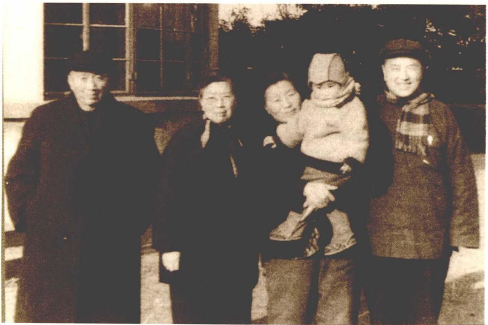
陈望道夫妇与谈家桢一家合影于复旦大学第九宿舍（20世纪50年代）