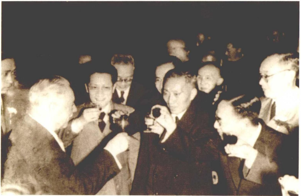
陈望道在欢迎前苏联国家元首伏洛希洛夫的宴会上（1955）