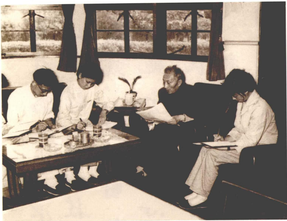
陈望道在复旦大学语言研究室与青年教师在一起