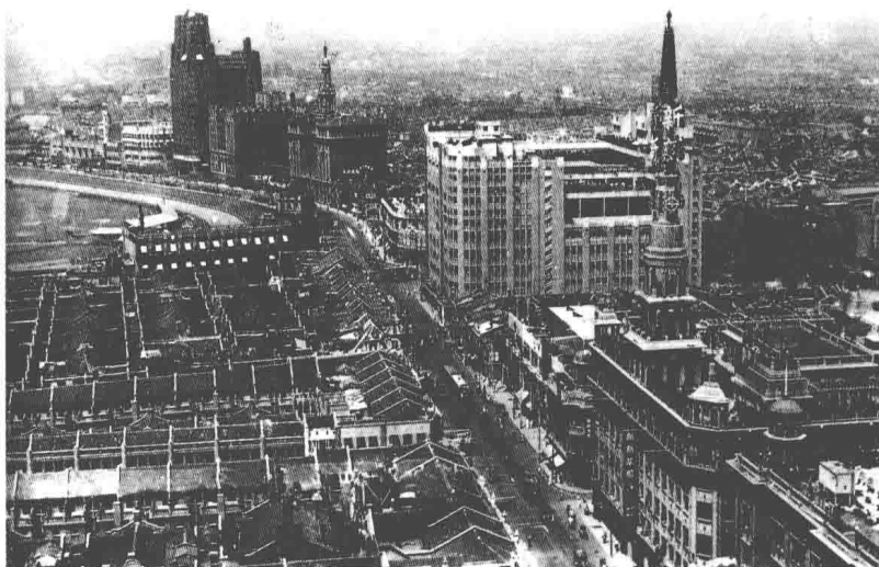
(b) 30年代中后期, 向西鸟瞰, 大新公司和新新公司大楼均已建成