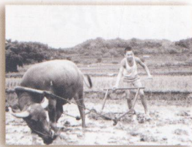
傳統看天吃飯，以人力獸力耕作的方式(上圖)，現今已隨著機械化及觀念改變，有機與休閒農業的農作方式應運而生，左上圖為水耕蔬菜溫室。

此外，由於不同的移民之間，也有可能因為鄉籍不同而出現爭執，因此，同鄉們經常共同居住，並根據所劃分的地界，運用大陸攜帶過來的農具從事開墾。此種基於墾植效率和安全防禦之考量，所發展出來的集村居住方式，即是台灣農村聚落形成的主要原因。