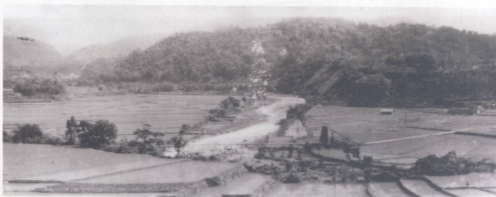
從這張南埔村老照片，可一窺30年代台灣農村的景象。

台灣早期為了落實平均地權，落實民生主義扶植自耕農，所推動一連串之土地改革，包括三七五減租、耕者有其田、公地放領、農地重劃等，使得台灣農村在結構上產生極大的變革，打破光復前之租佃制度，造就了數十萬的小資產階級，在當時以農業為主要經濟重點之台灣，上述政策確實使得廣大農民及國家經濟獲得極大改善。不過，在空間上卻也使得台灣的農業逐漸走向小面積經營之必然。