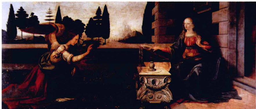
达·芬奇第一幅独立完成的作品《受胎告知》