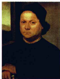
达·芬奇的老师维罗其奥

达·芬奇在世上活了67个年头，这在十五六世纪时已经算是很长寿的了。但是在他漫长的一生中，留存至今的绘画作品只是少之又少的十几幅而已。其中除了《蒙娜丽莎》和几幅其他女子的肖像外，几乎都与宗教有关，大多数以《圣