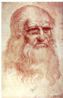
达·芬奇晚年自画像

被恩格斯誉为“巨人中的巨人”的列奥那多·达·芬奇，头上有着太多的光环：“文艺复兴时期最负盛名的艺术大师”、“人类智慧的象征”、“文艺复兴精神最完美的代表人物”，以及集画家、科学家、建筑师、数学家、哲学家、解剖学家、天文学家、军事学家、物理学家和机械工程师……于一身的百科全书式的伟人。要用电影的形式来表现这样一个人，其难度可想而知；更何况他终生未婚，除了他在24岁时因被怀疑有同性恋遭拘捕后又不了了之的一场诉讼之外，他一生几乎没有任何婚恋的经历，这就让以爱情为永恒主题的电影，失去了最主要的表现元素。但好在达·芬奇充满传奇的经历和所创造的不朽成就，足以支撑起一部电影的容量，更因为他生活在一个风云际会、英雄辈出、至今令人怀念的时代，因此人们对于达·芬奇的电影总给予很高的期待和关注。