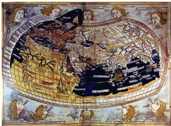
绘制于15世纪末的托勒密世界地图

在结束了长达千年“黑暗的中世纪”后，欧洲从14世纪起进入了文艺复兴时期。人们将文艺复兴比喻为酣睡了数个世纪的“睡美人”，古典希腊和罗马在意大利苏醒了。就像罗马的双面神杰纳斯，文艺复兴也是一面向前，一面向后。