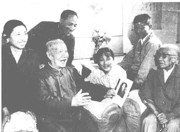
1976年陈鹤琴和家人欢庆粉碎“四人帮”，并讲述他十一次会见毛主席的情景。