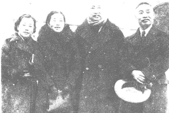
1937年2月陈鹤琴代表中华慈幼会与熊希龄等赴爪哇出席国际联盟召开的远东禁贩妇孺会议。这是抵达时摄(右起陈鹤琴,熊希龄,毛彦文,关瑞梧)。