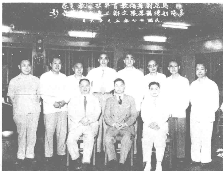
1948年4—6月陈鹤琴前往菲律宾讲学。5月26日马尼拉华侨教育界欢迎晏阳初(一排中)、陈鹤琴(左)、张文郁(右) 菲合摄。