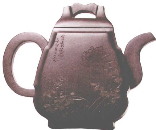
古琴壶。原紫砂一厂老拼紫泥，容量500cc，罗荣贤作。