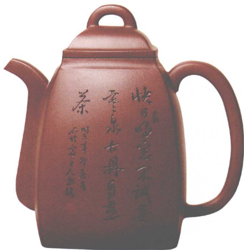
汉方壶。黄龙山老紫泥，容量550cc，罗荣贤作。