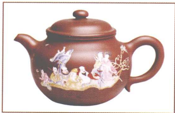
莲子壶（八仙过海）。容量1000cc，高13cm，口径8.8cm，泥料老拼紫，江政凌作。

此壶仿传统莲子壶制作，对壶的形、神、气三者融会贯通，作者将自己的艺术思想用紫砂语言充分表达出来，彩绘八仙过海图使紫砂艺术更富有美感，使观者不仅能感受到中国传统文化博大精深的文化内涵，还能在欣赏该紫砂壶的过程中，获得丰富多彩的视觉享受和审美愉悦。