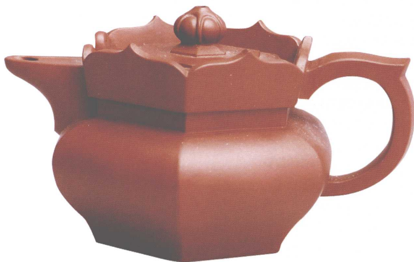
僧帽壶。容量150cc，高7.7cm，口径4.7cm，泥料清水泥，江政凌作。

此壶以传统僧帽壶制作，造型比较奇特，壶身为六边形，壶盖为五瓣莲花形，第六瓣为壶嘴，与壶把前后呼应，看似一个唐僧帽。