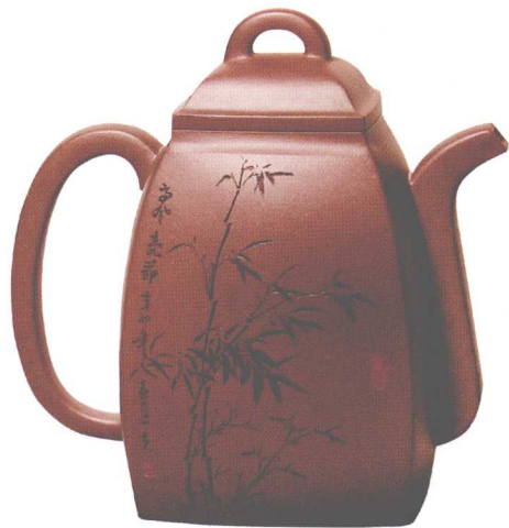
汉方壶。黄龙山老紫泥，容量550cc，罗荣贤作。

“景舟壶”近来备受市场追逐，2010年，一把“相明石瓢壶”被拍出1232万元的天价，创下紫砂壶拍卖的世界纪录，这也使得这把壶的创作者——已故中国工艺美术大师顾景舟成为紫砂界的巅峰人物。在宜兴拍卖会上，顾景舟生前创作的“大口扁腹壶”和“三足乳钉壶”理所当然掀起了全场的最高潮。