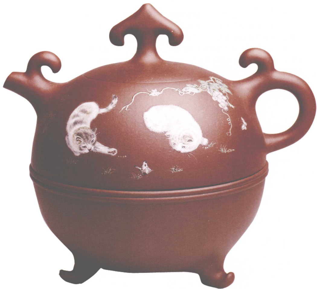
称心如意壶（双猫图）。容量450cc，底槽清，高16cm，口径6.3cm，江政凌作。