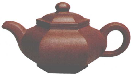
六方掇只壶。容量350cc，高9.7cm，口径5.5cm，底槽清，江政凌作。

紫砂大师顾景舟的两件紫砂作品不负众望，分别摘得该场冠、亚军。其中“云肩如意三头茶具”从200万元的起拍价开始，拍价一路扶摇直上，在报出800万元之后，经过多