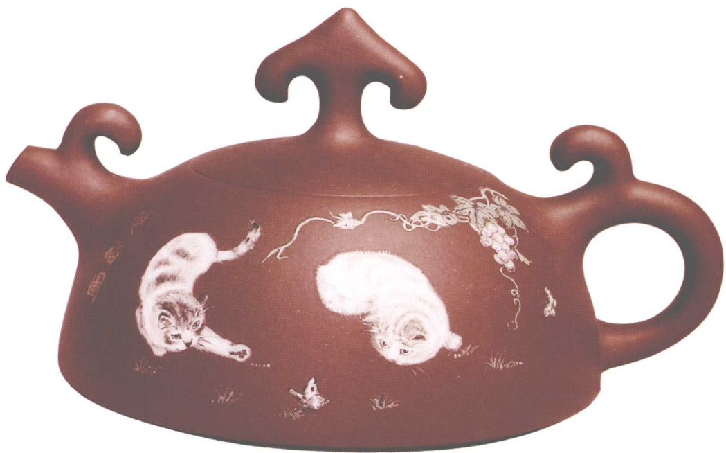
称心如意壶（双猫图）。容量450cc，高16cm，口径6.3cm，底槽清，江政凌作。

该场嘉德春拍，“提梁盘壶”以1150万元成交，这一单价再破千万的大师壶1988年由韩美林设计，顾景舟制作，直线与弧线交错运用，转折处明快流畅。提梁及盖的设计新