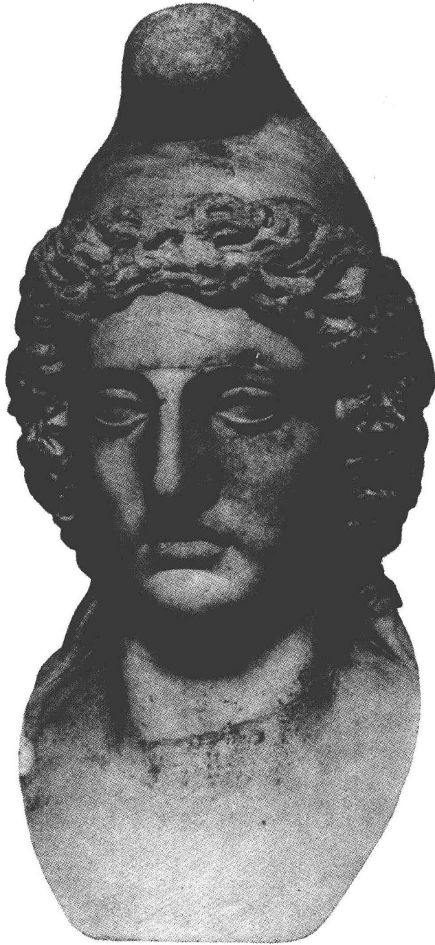
奥斯蒂亚的米特拉神头像