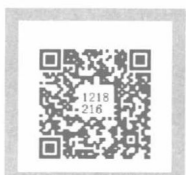
教育活动的组织与实施