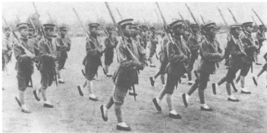
吴佩孚严格训练新兵

将”“勇将”“儒将”“大将”八种，每一种都规定了严格的标准和要求，以此来激励将领进取向上。吴佩孚用兵极注重部队的整体素质，他认为兵贵在精而不在多。一支精锐的部队，除了训练有素以外，还必须纪律严明。他还认为兵不可富，因为富则思家；兵亦不可穷，穷则生怨；兵不可闲，闲则生惰心；兵不可浪，浪则放心生。所以，训练部队要“教法善，操法勤，立法严，立赏宽，令出肃，成功巧，法之明”。他要求士兵实行“六戒”，即戒酒、戒色、戒财、戒气、戒烟、戒赌。在纪律方面，吴佩孚本人就是一个严肃的纪律执行者。在军事教育上，他要求自己的部队“既是民国人，即当立志恢复民国之真正共和，要想恢复民国共和，须先恢复中国一贯相传之忠孝”。