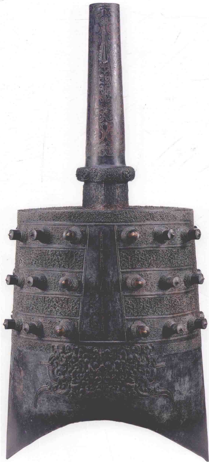
图〇一九 下二8钟体（反面）