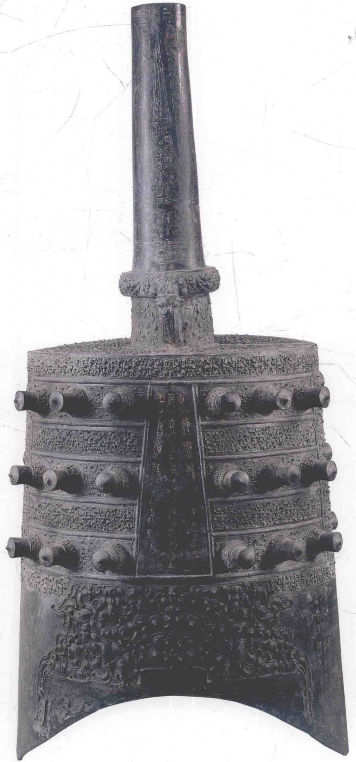
图00八 下二1钟体（正面）