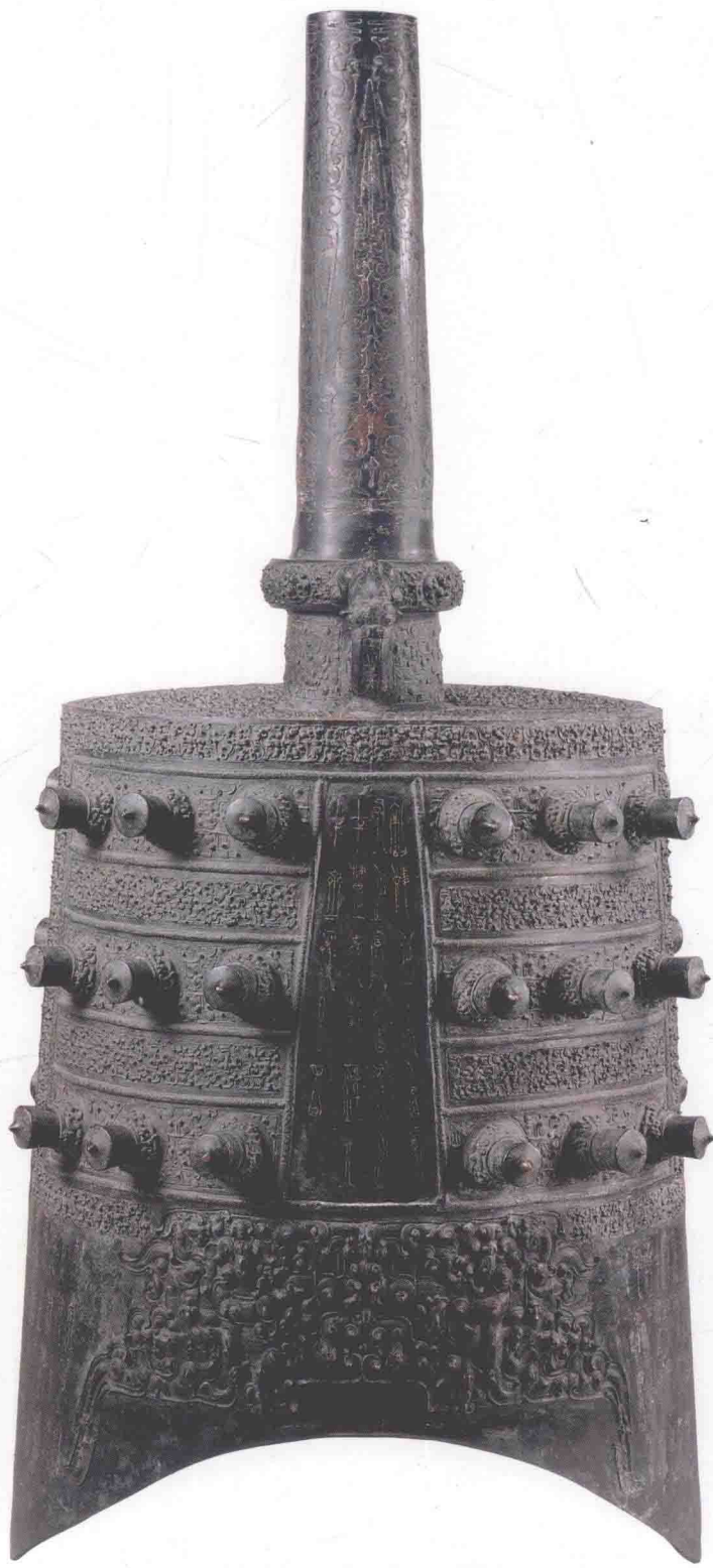
图〇一〇 下二钟体（正面）