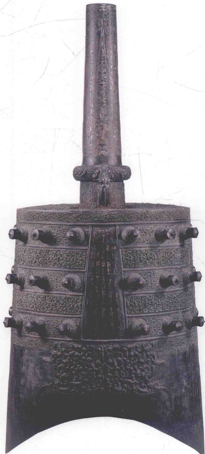
图〇二〇 下二8钟体（正面）