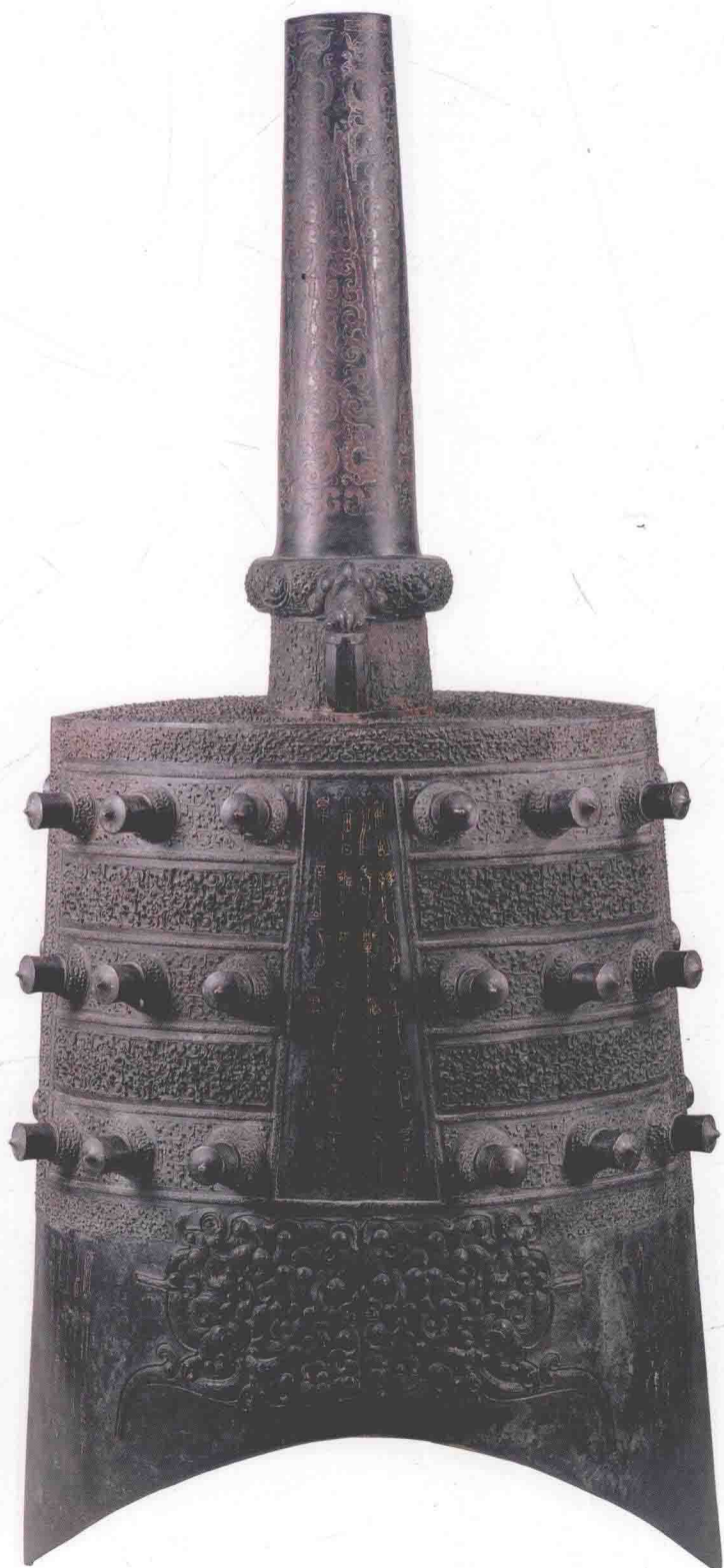
图〇一八 下二7钟体（正面）