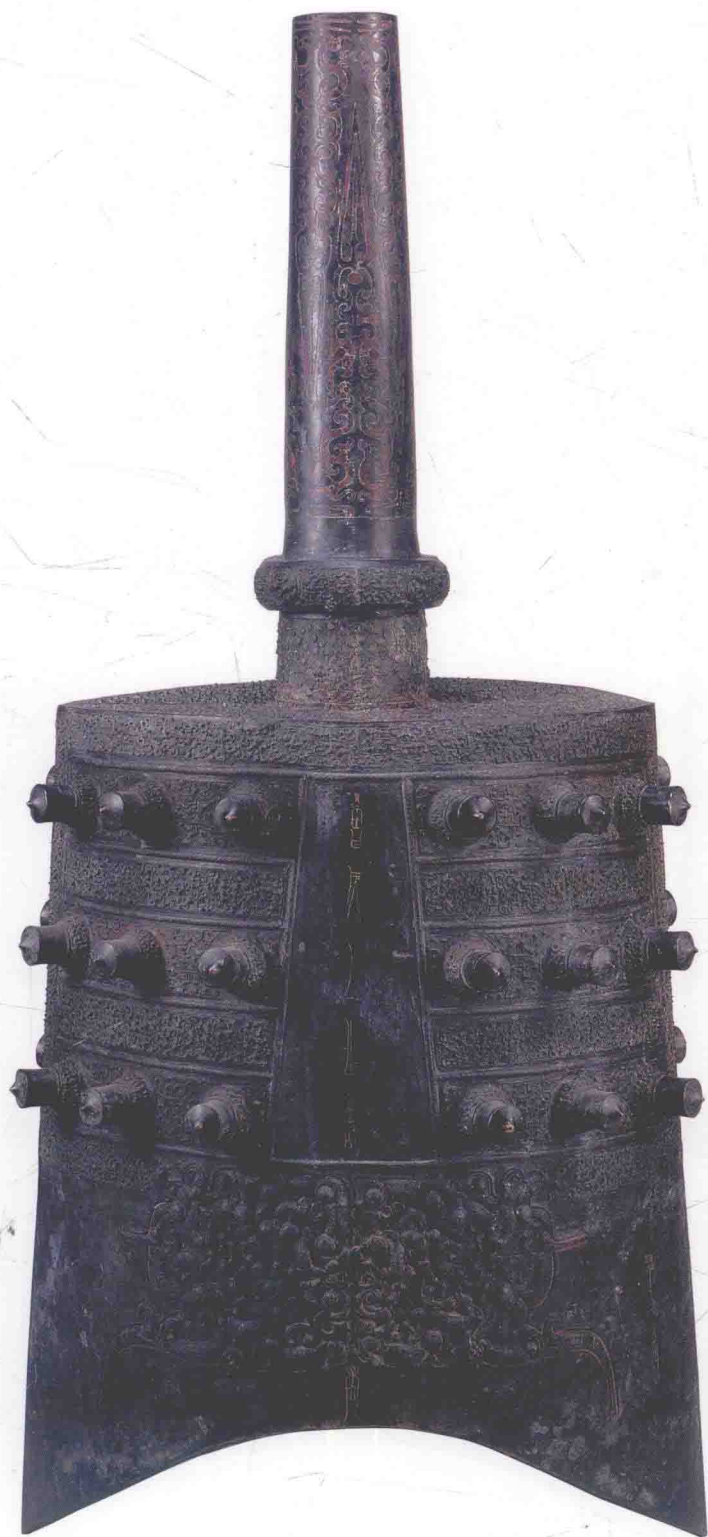
图〇一三 下二4钟体 (反面)