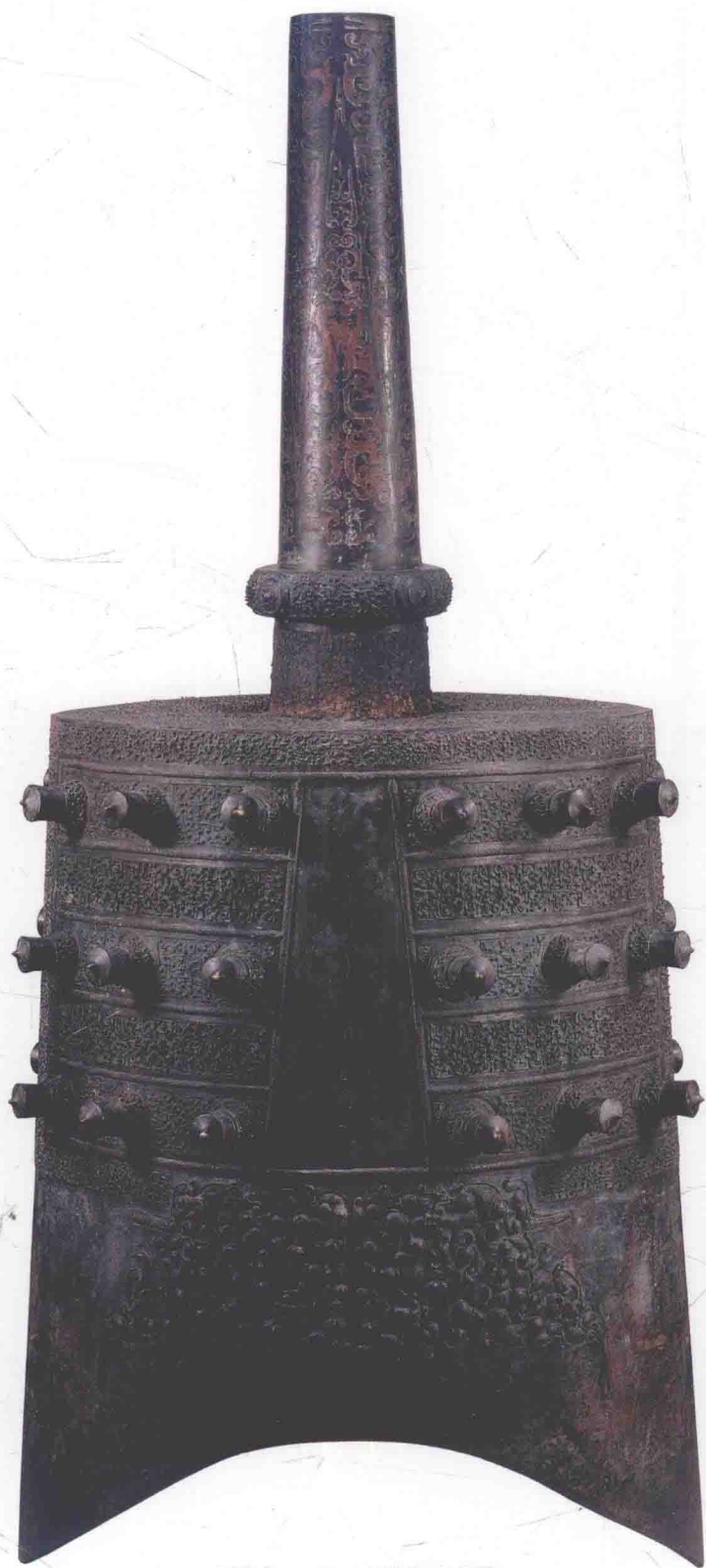
图00一 下-1 钟体 (反面)