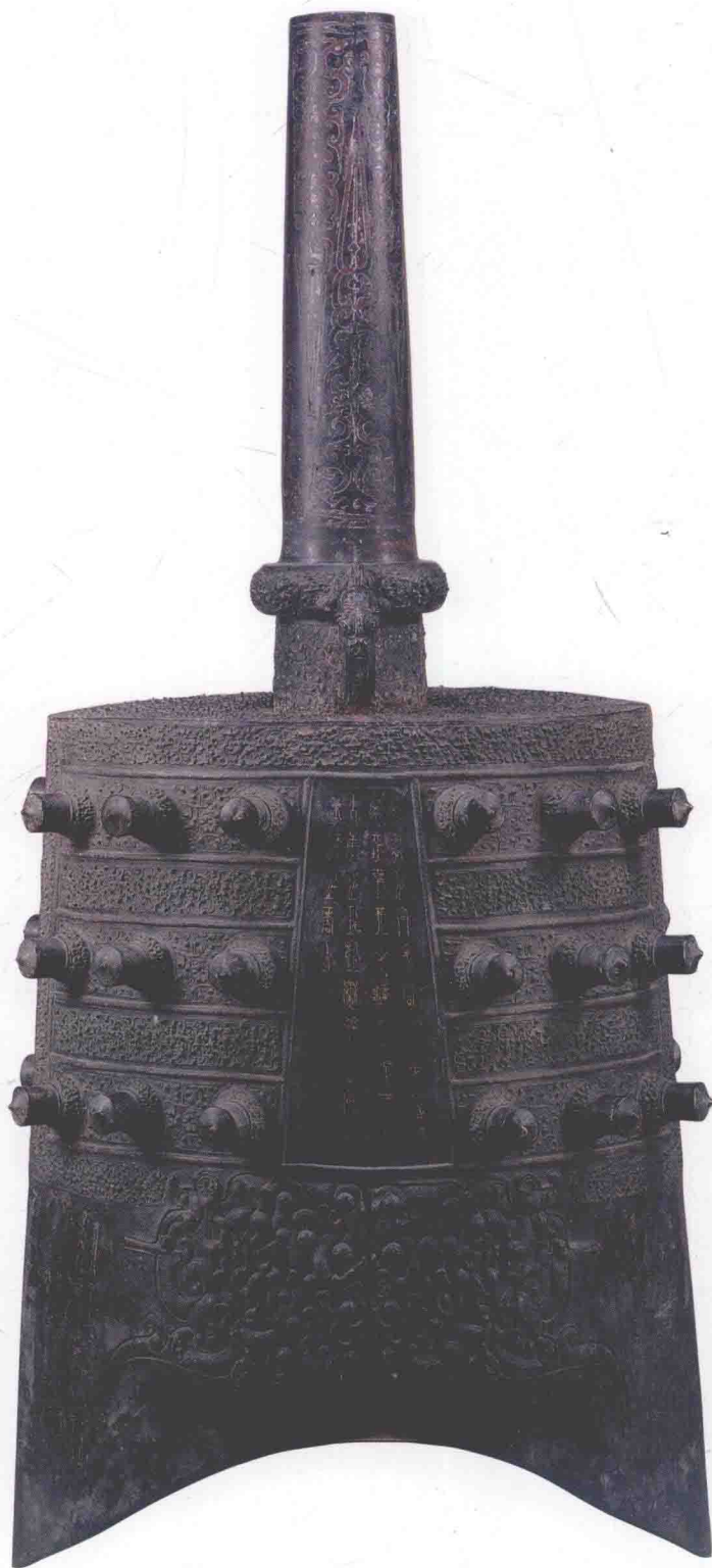
图〇一四 下二4钟体 (正面)