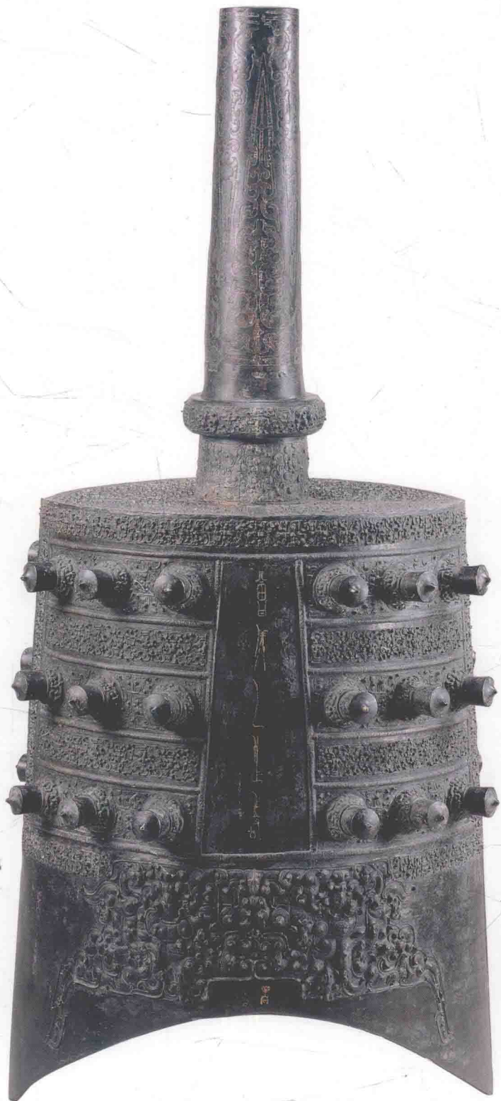
图〇〇九 下二钟体（反面）