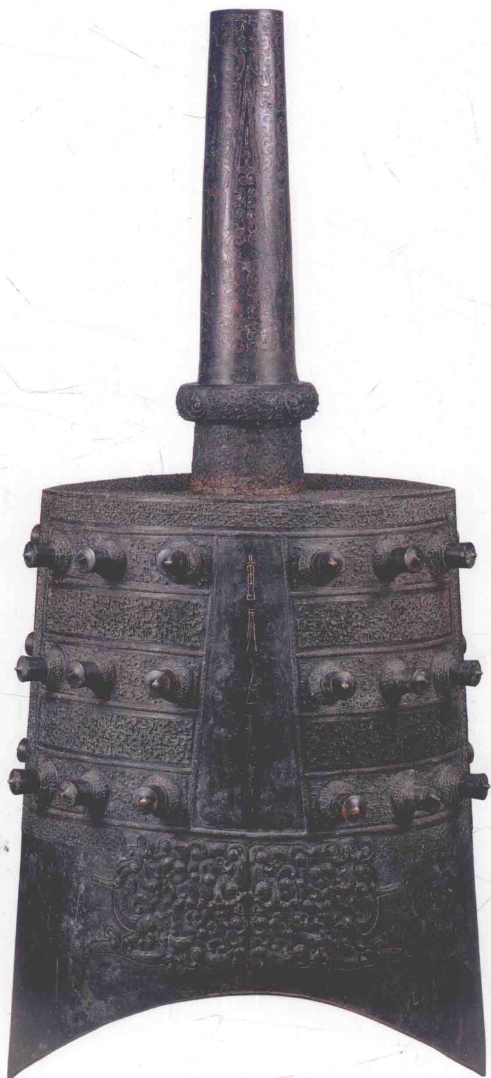
图〇一七 下二7钟体（反面）