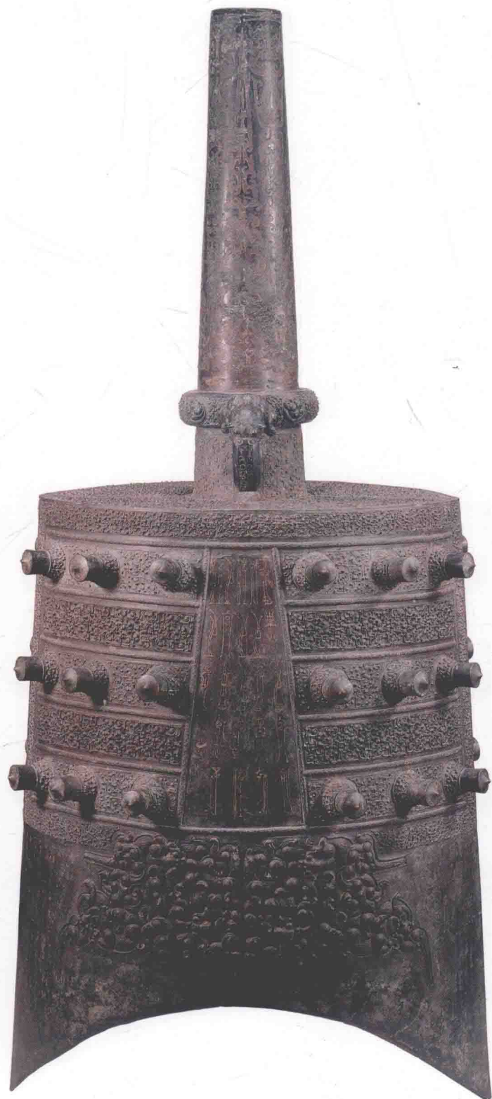
图00六 下一3钟体（正面）