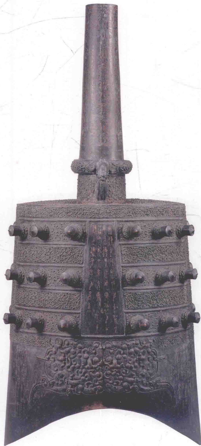
图〇一六 下二5钟体（正面）