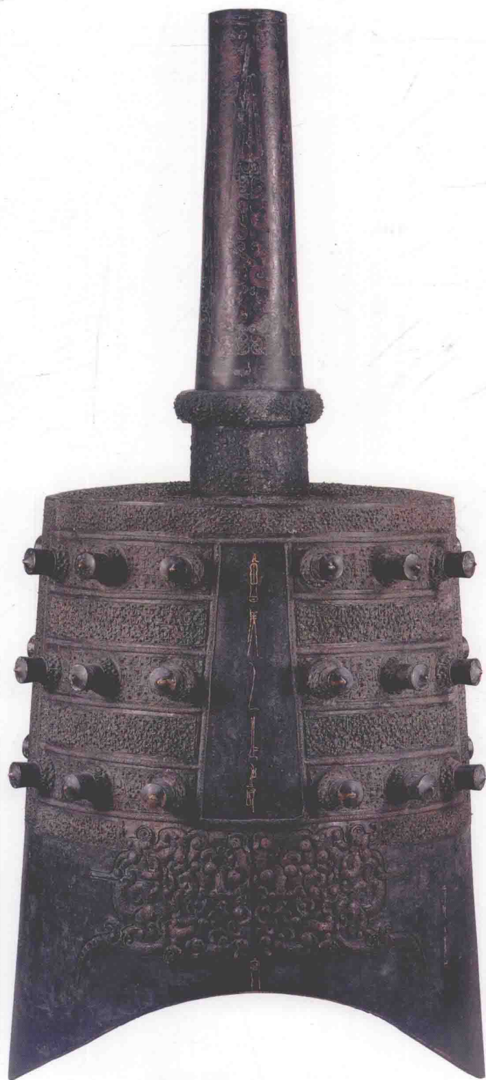
图〇一五 下二5钟体（反面）