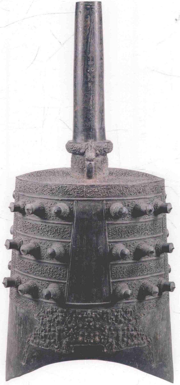
图〇一二 下三钟体（正面）