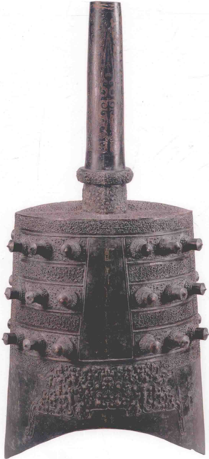
图〇一一 下三钟体（反面）