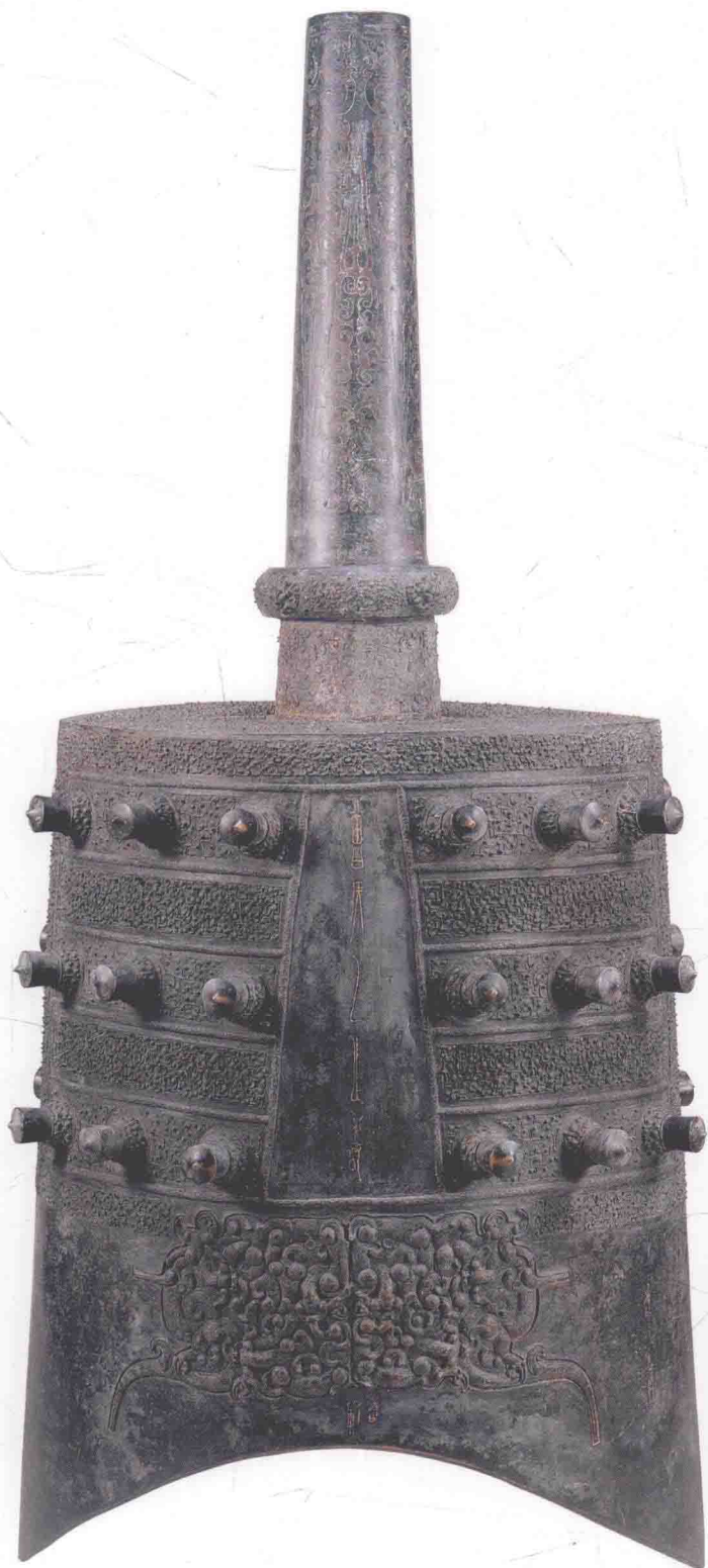
图00五 下一3钟体（反面）