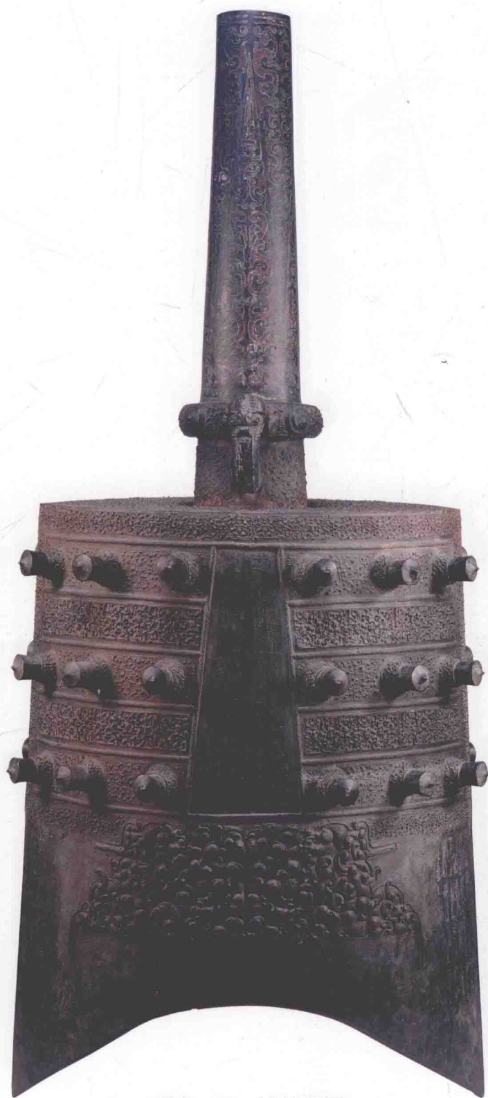
图00二 下-1 钟体 (正面)