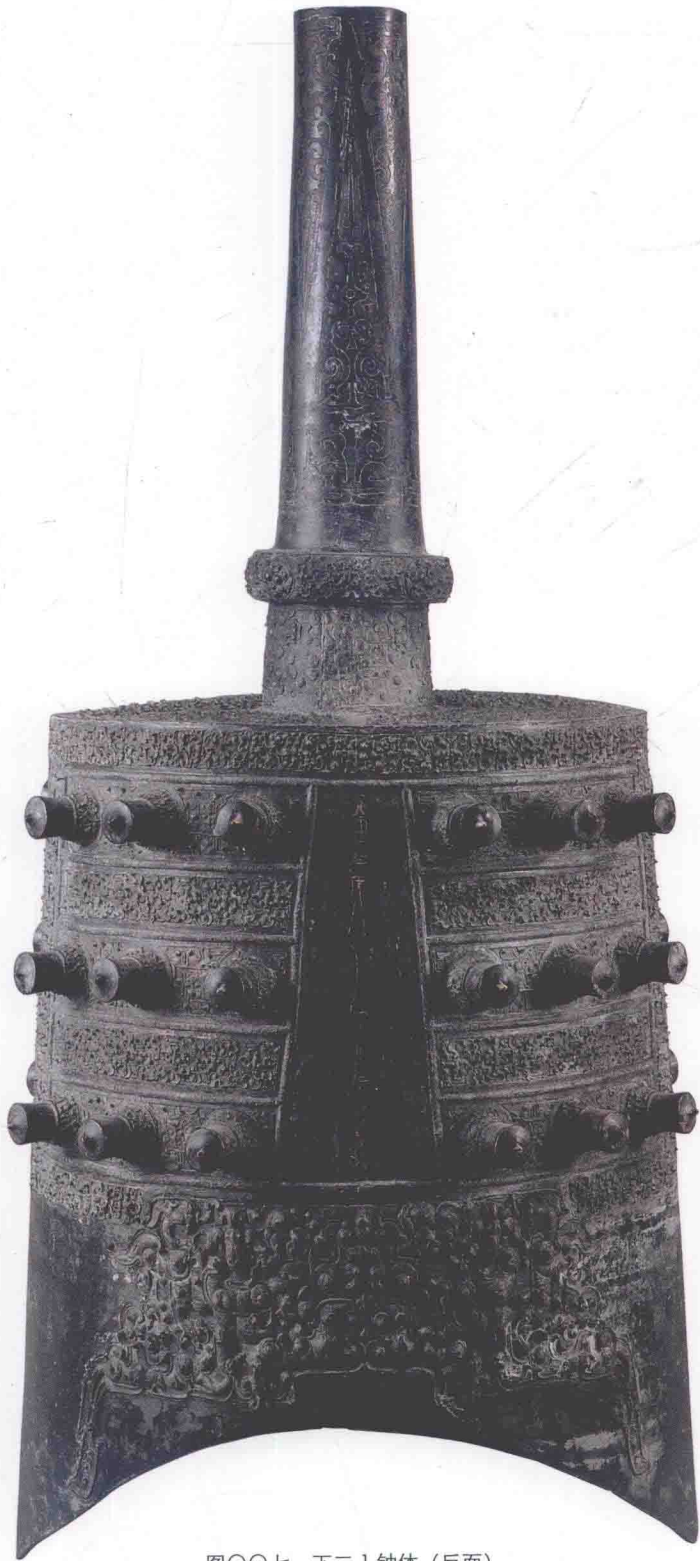
图00七 下二1钟体（反面）