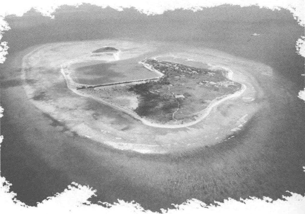
航拍琛航岛。它和广金岛、金银岛、珊瑚岛等同在一个环形礁盘上。