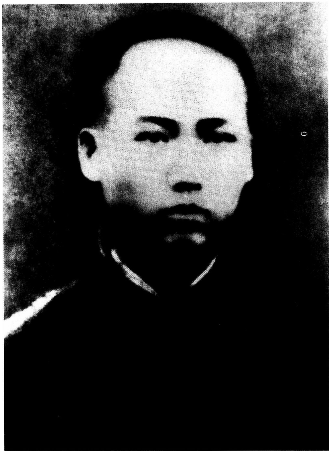
1913年，在湖南省第四师范学校求学时的毛泽东。