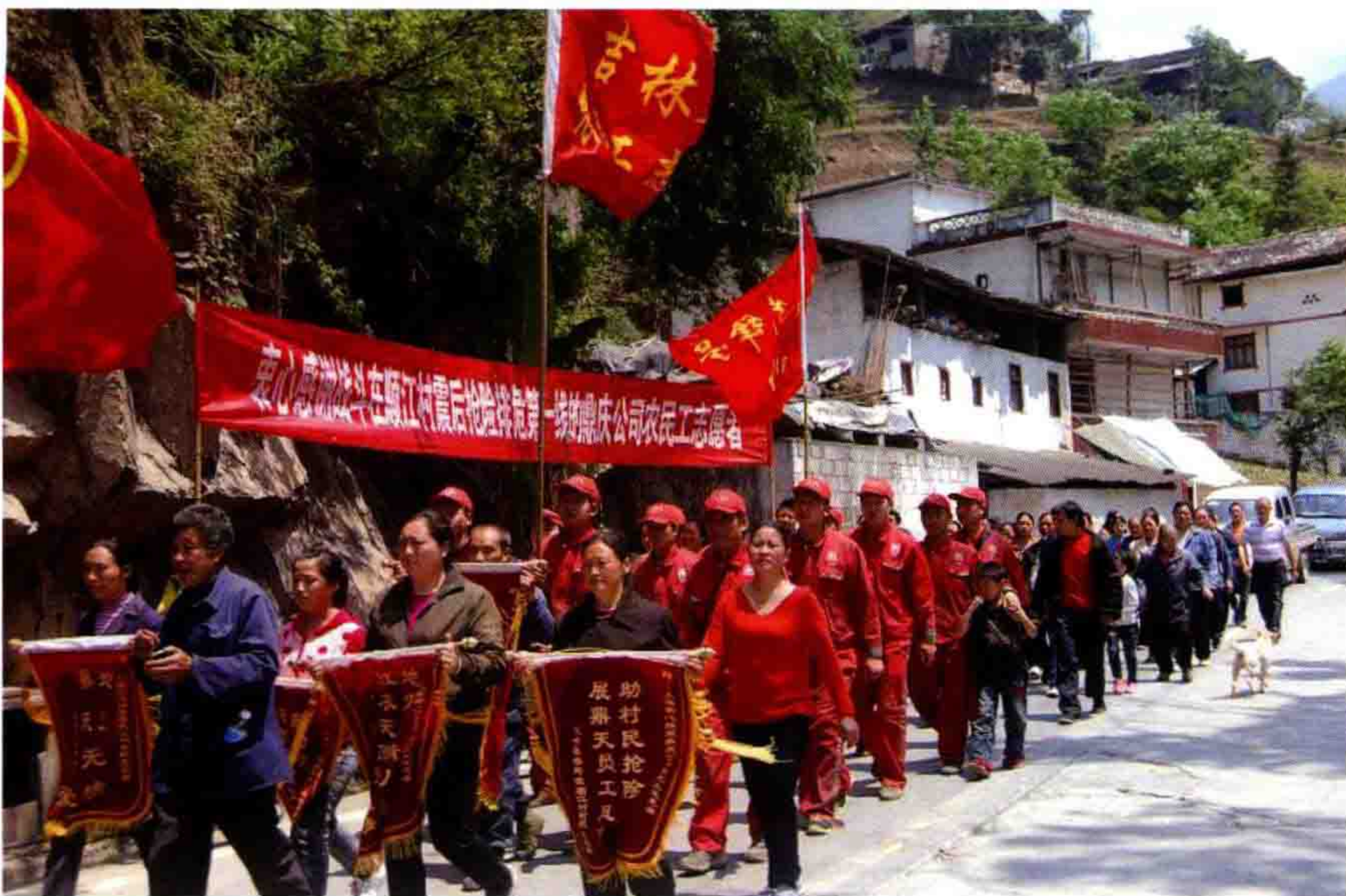
◎ 雅安受灾百姓感谢鼎庆志愿者