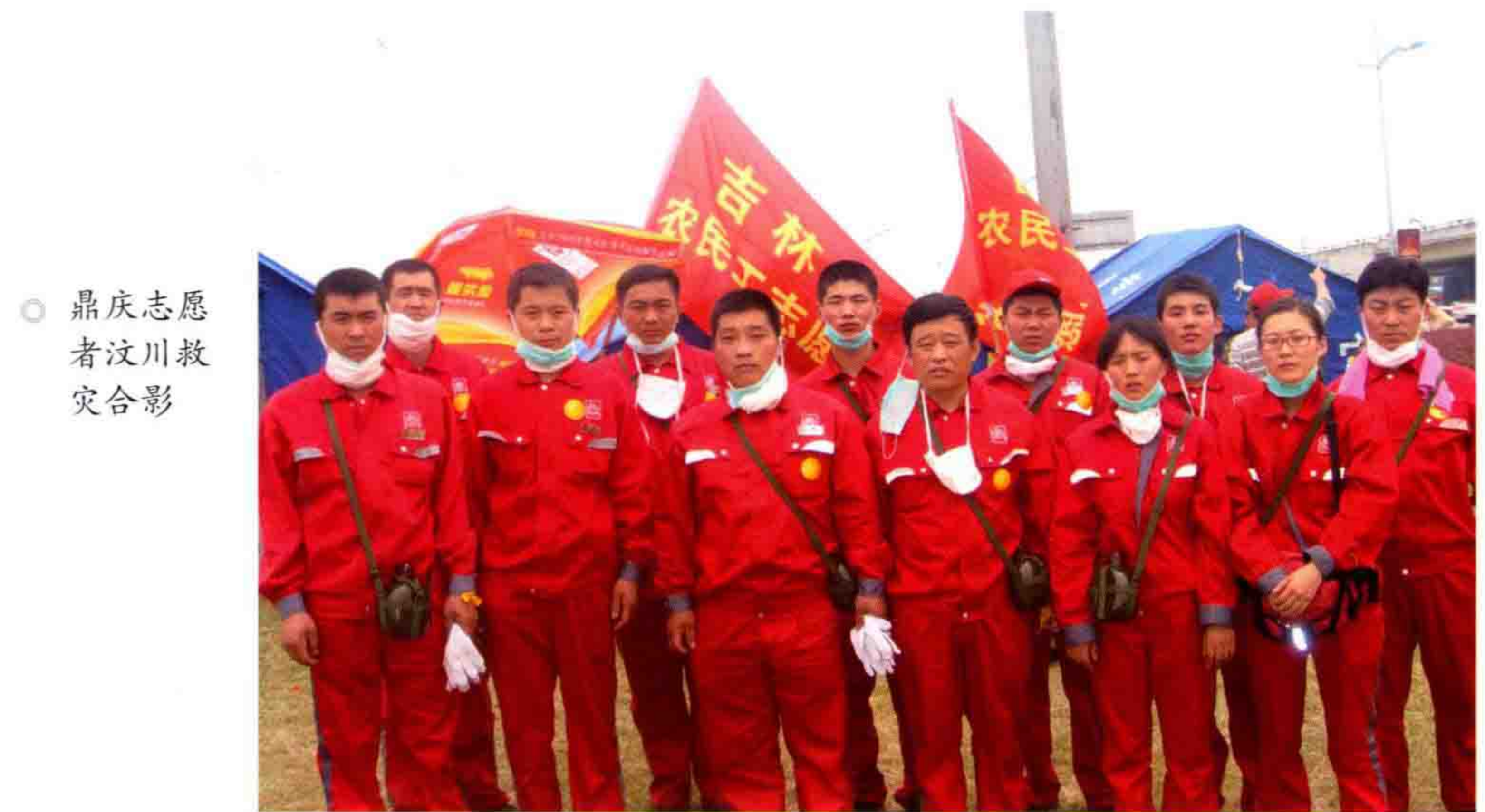
◎ 鼎庆志愿者汶川救灾合影