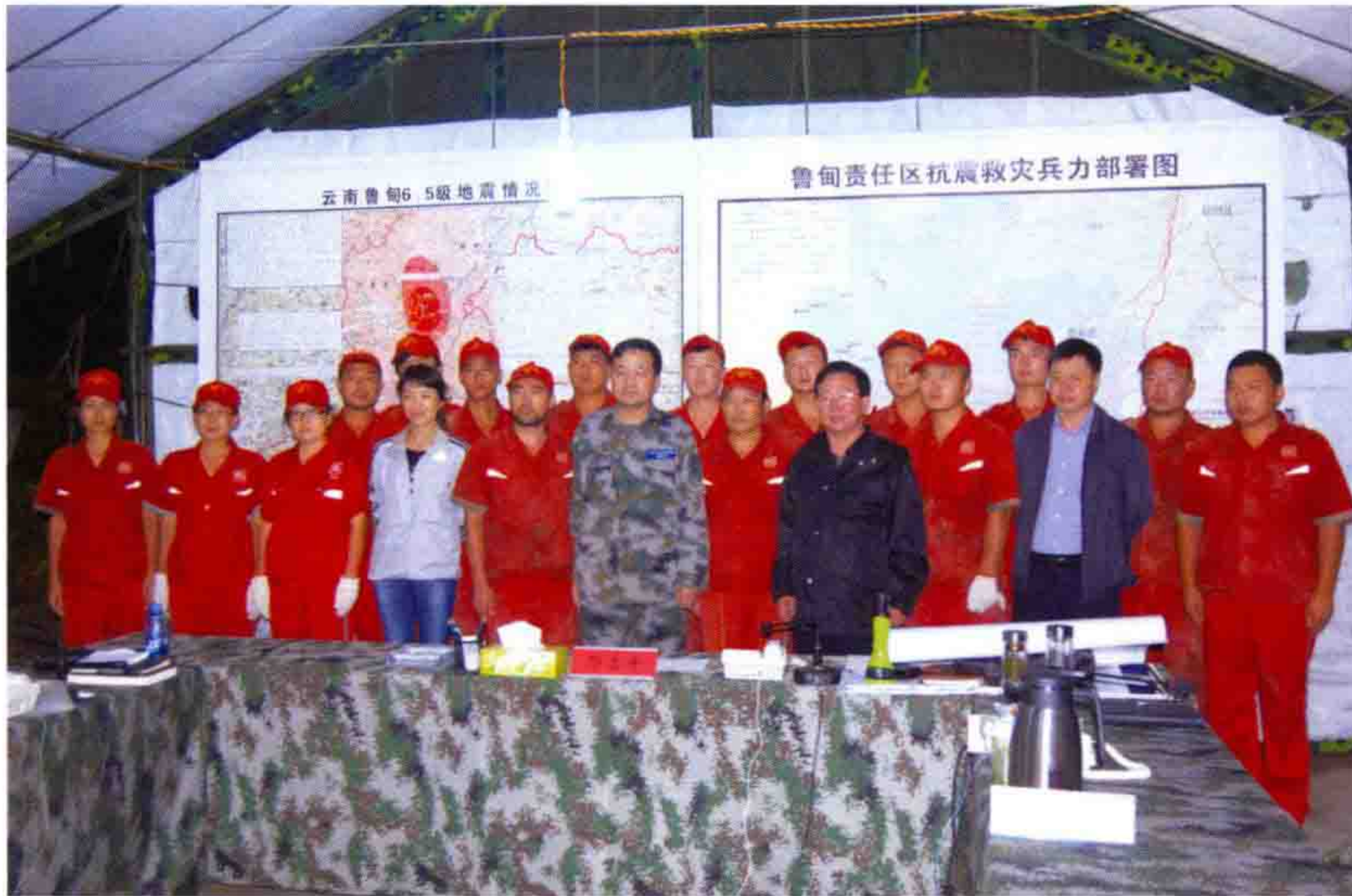
◎ 鲁甸抗震救灾 鼎庆志愿者与 第十四集团军 副军长邓志平 合影