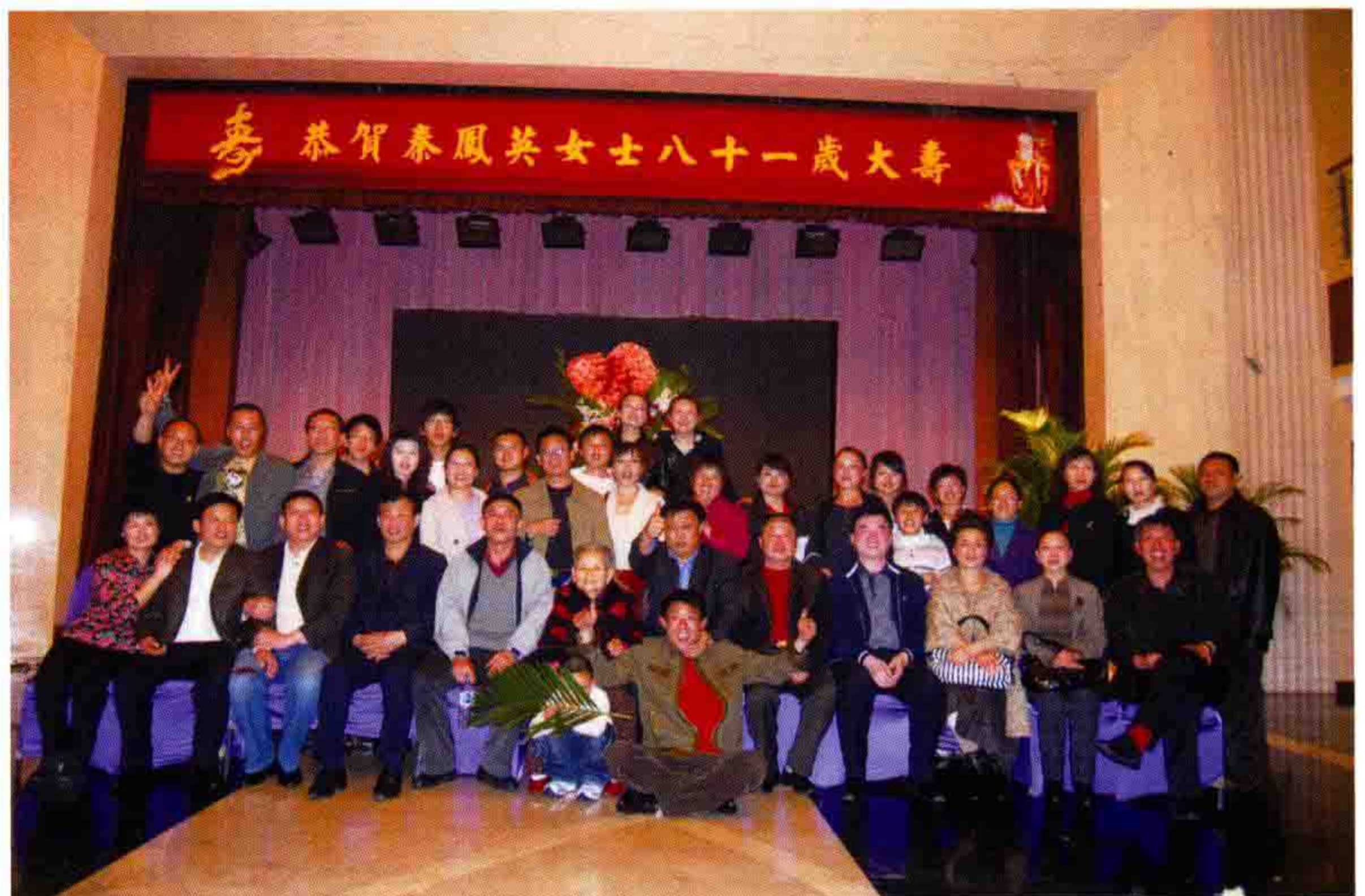
◎ 李氏家族为老妈妈祝寿