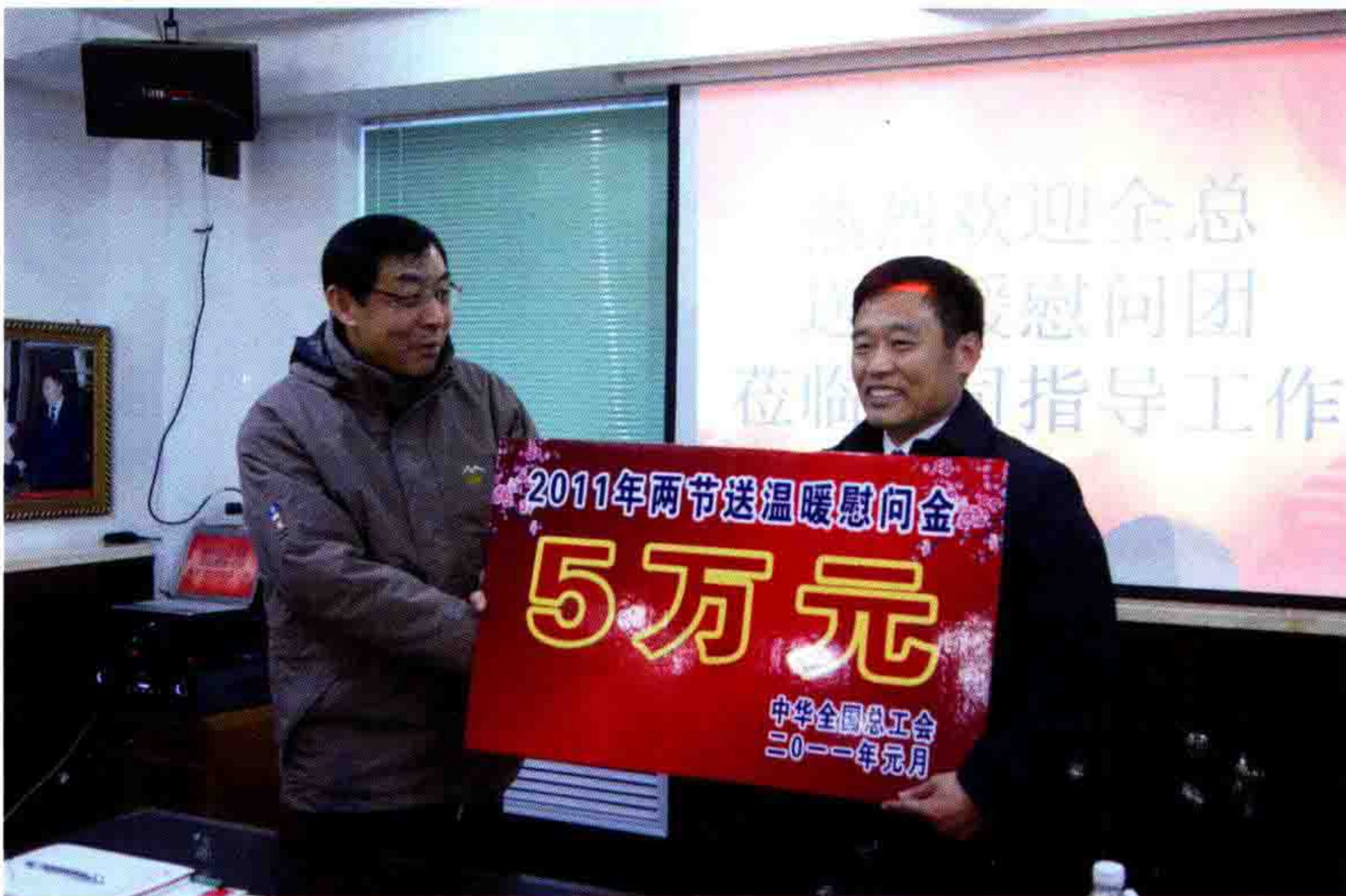
◎ 中华全国总工会副主席马培华莅临慰问指导工作