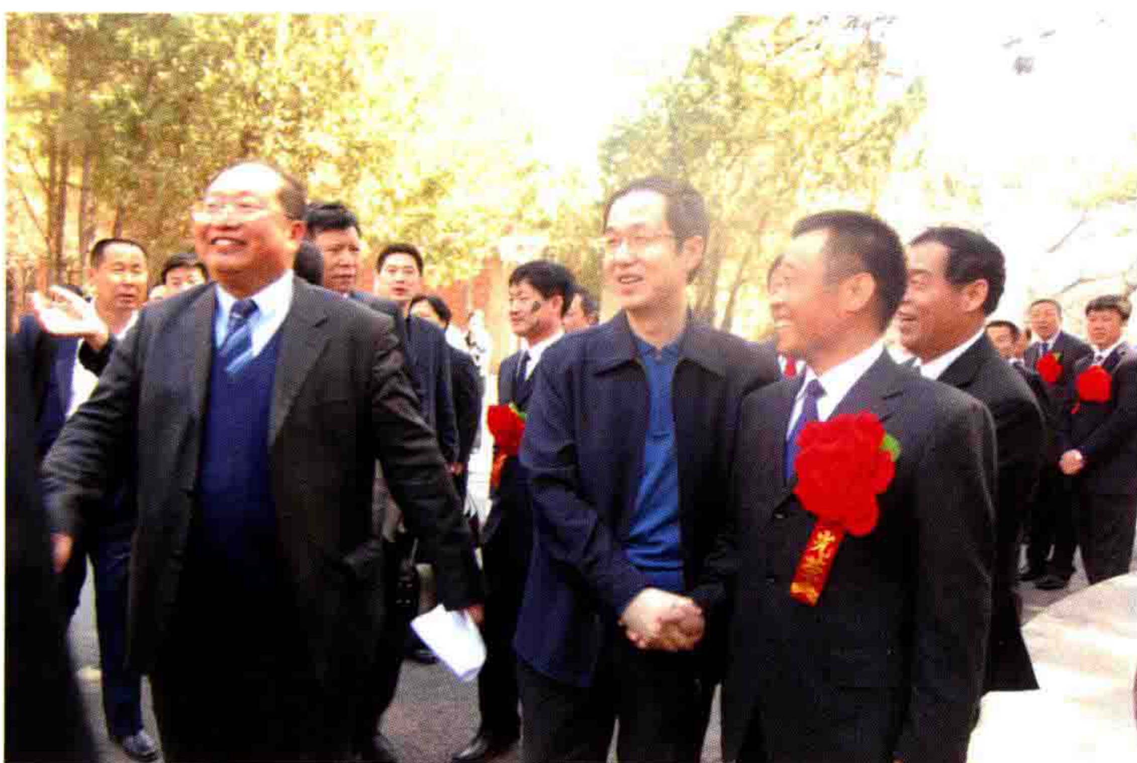
◎ 李万升受到前吉林省委常委、长春市委书记高广滨的亲切接见