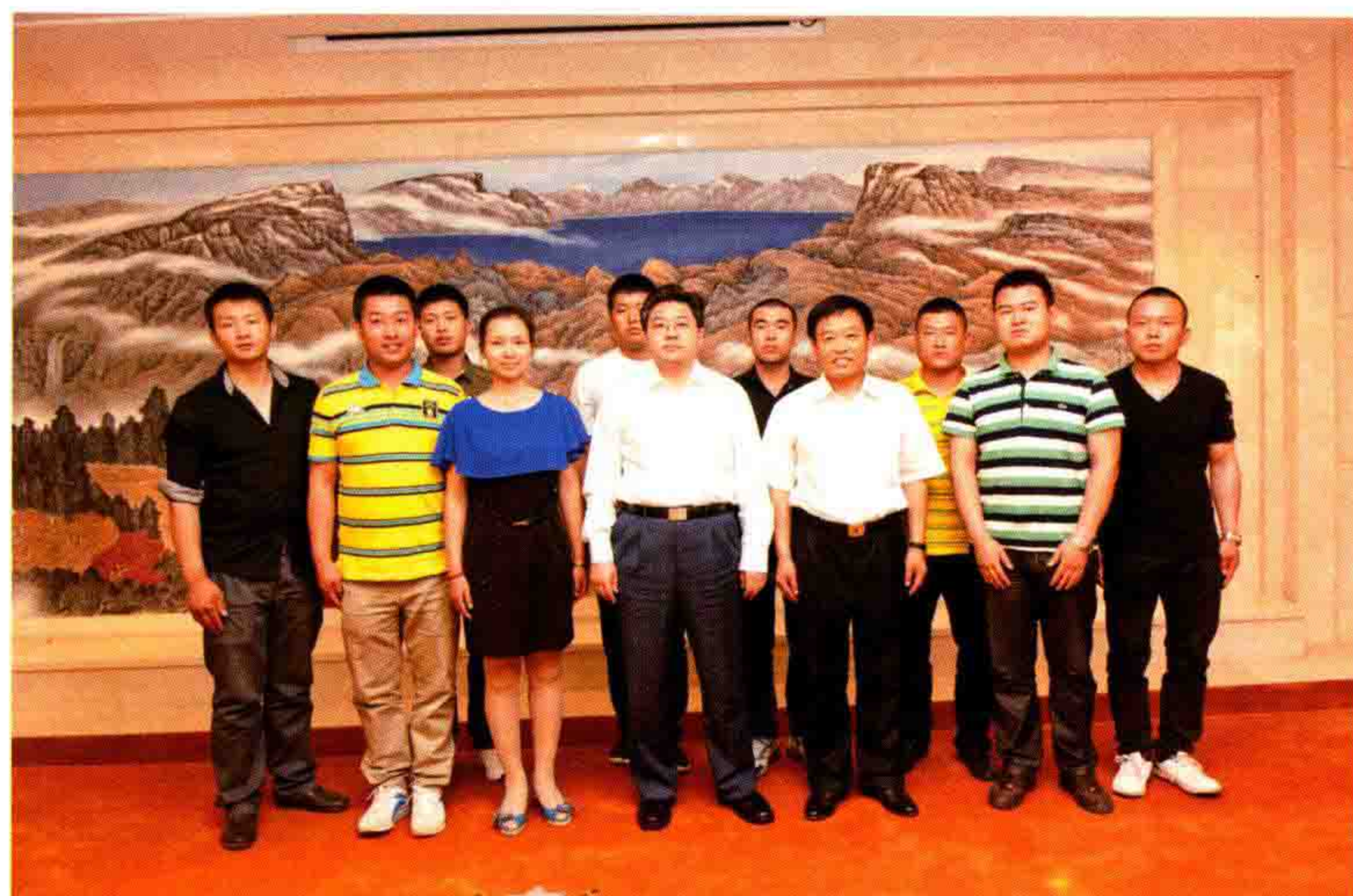
◎ 吉林省副省长隋忠诚接见鼎庆农民工志愿者代表