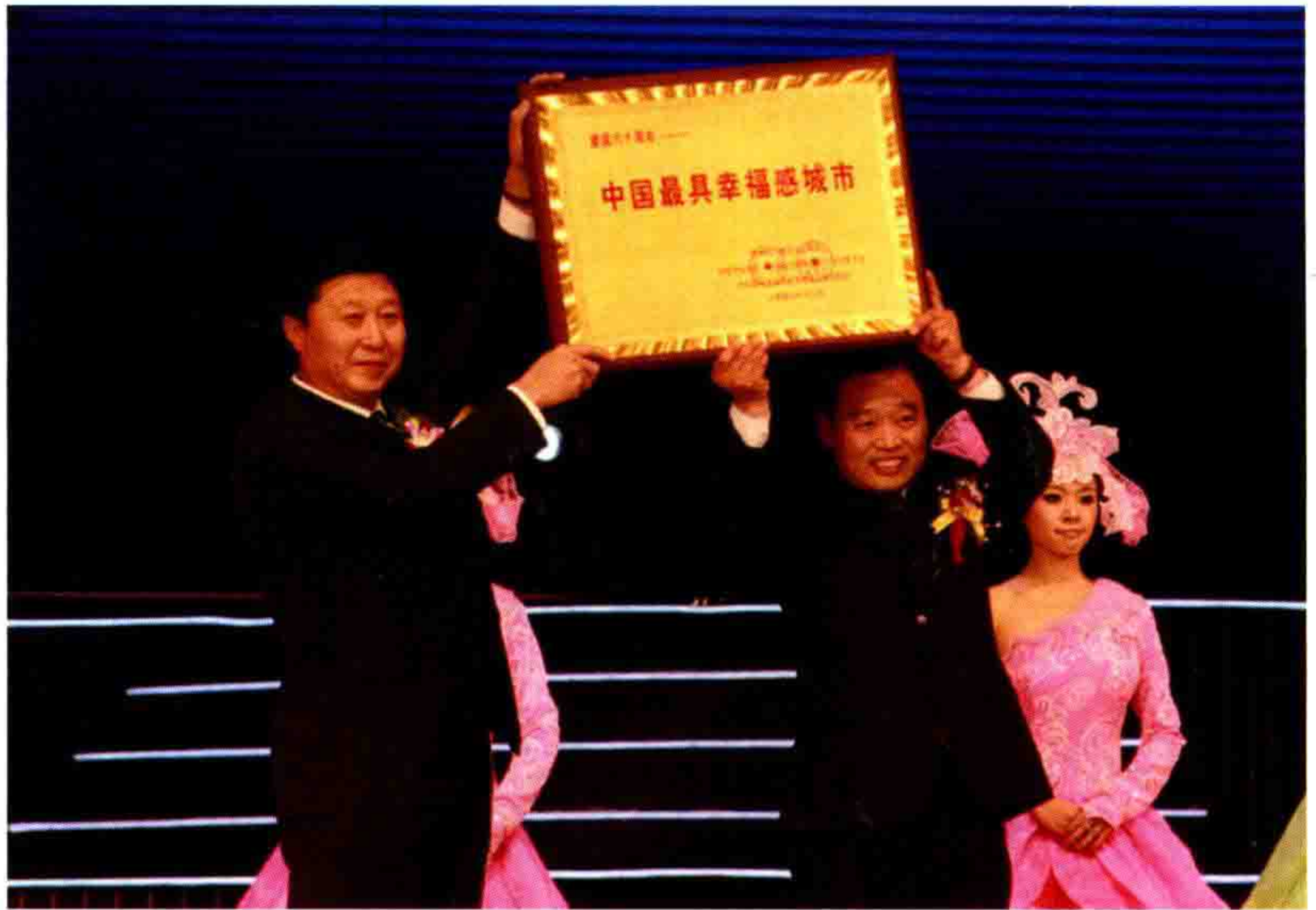
◎ 长春市委常委、政法委书记王振华与李万升共同领取“中国最具幸福感城市”奖