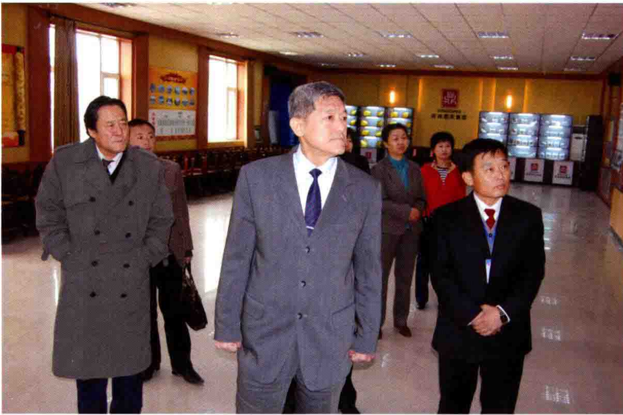
◎ 前吉林省政协副主席林炎志莅临指导工作