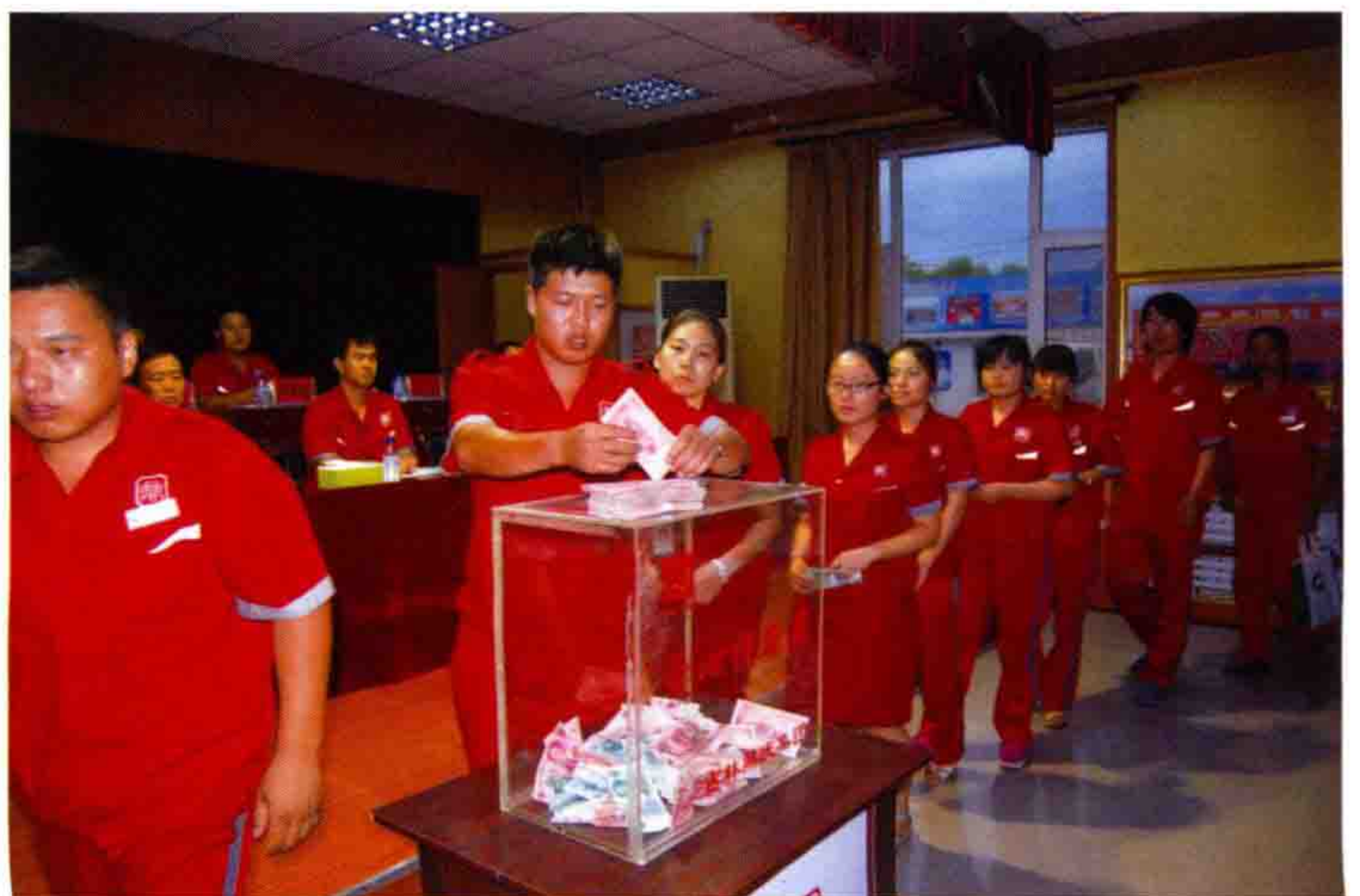
◎ 鼎庆员工为灾区捐款