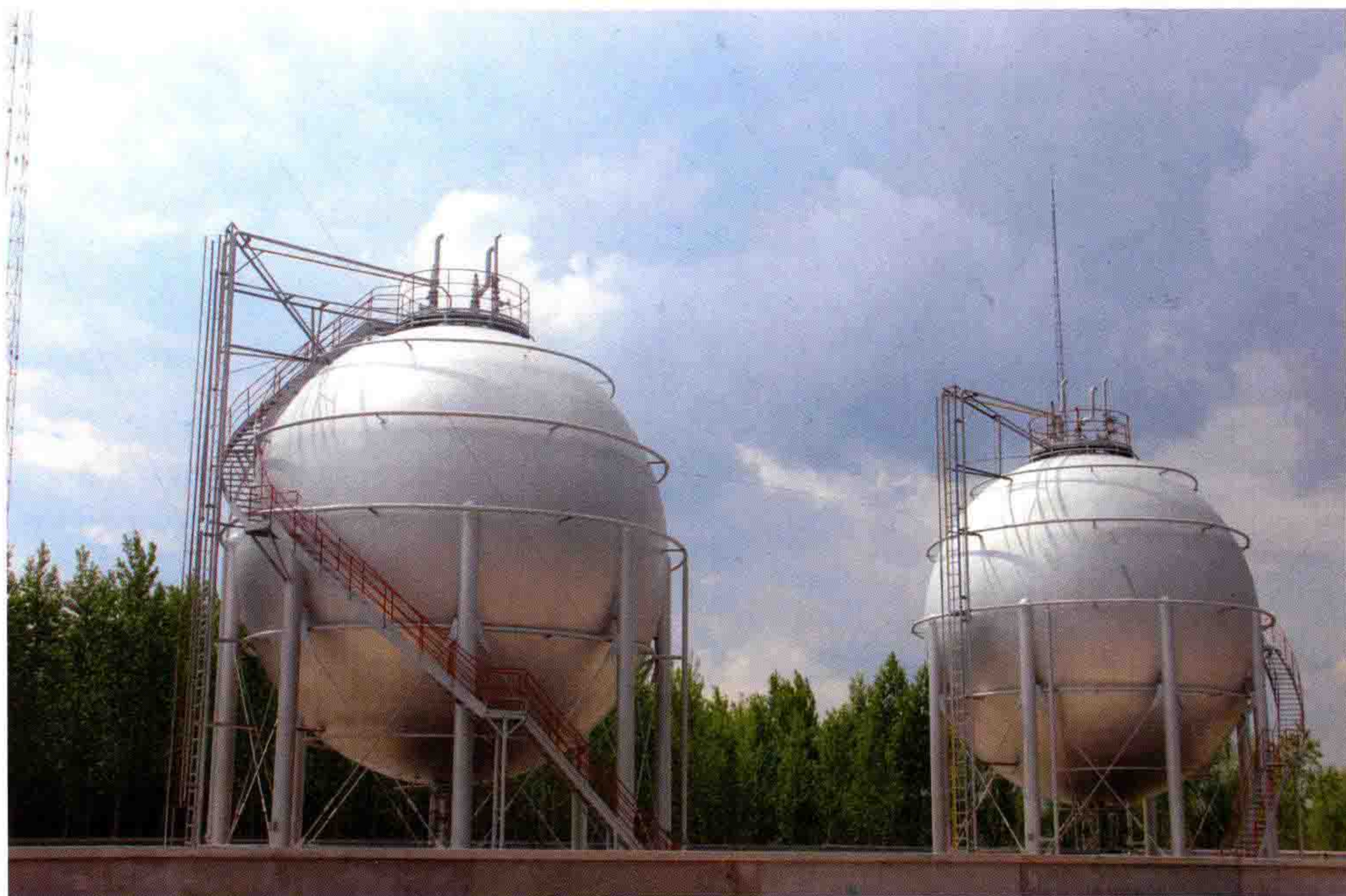
◎ 鼎庆集团长春绿园西新工业集中区建设的液化气储存基地