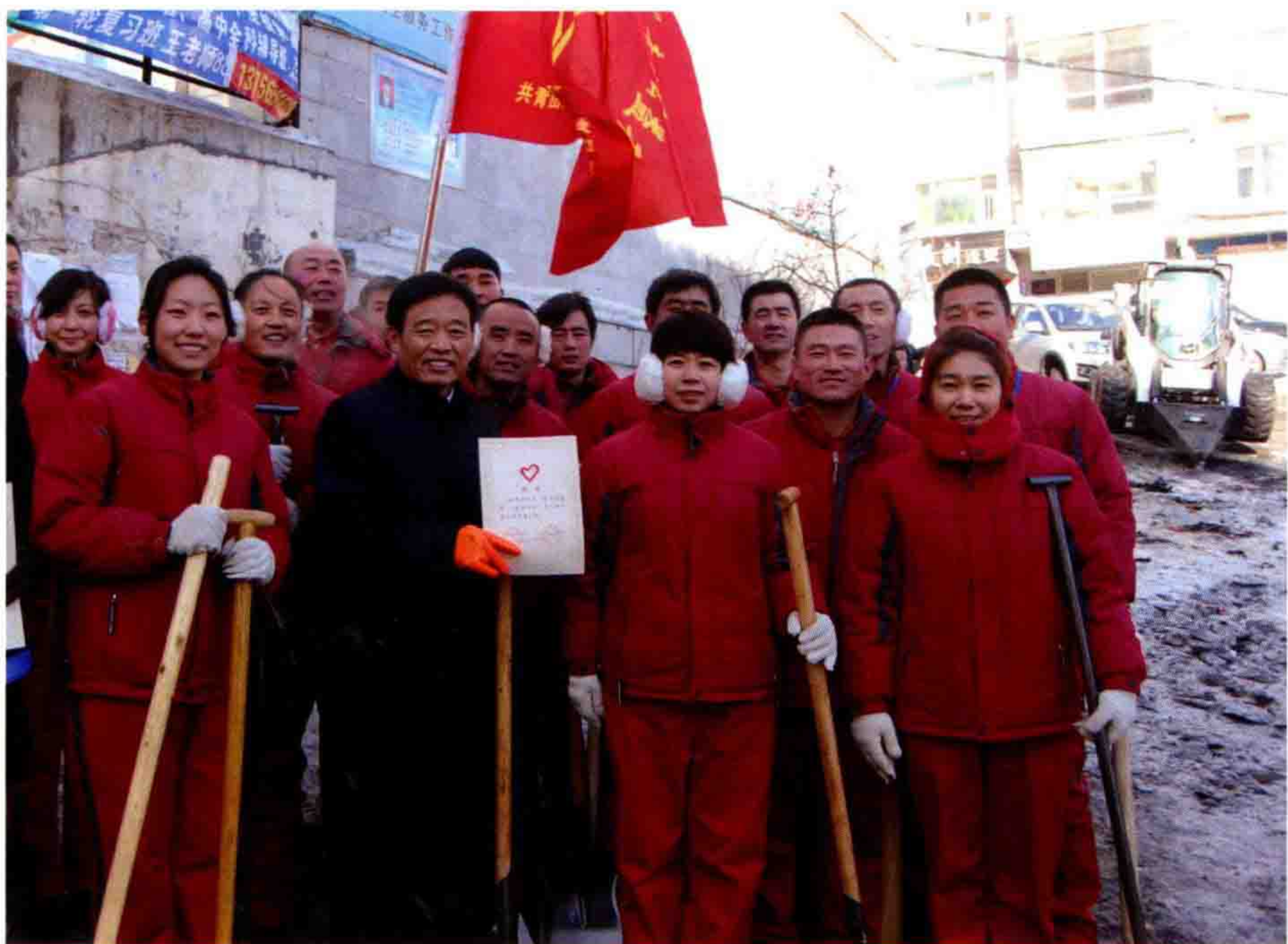
◎ 鼎庆党支部组织员工参加“做个志愿者，一起来扫雪”活动