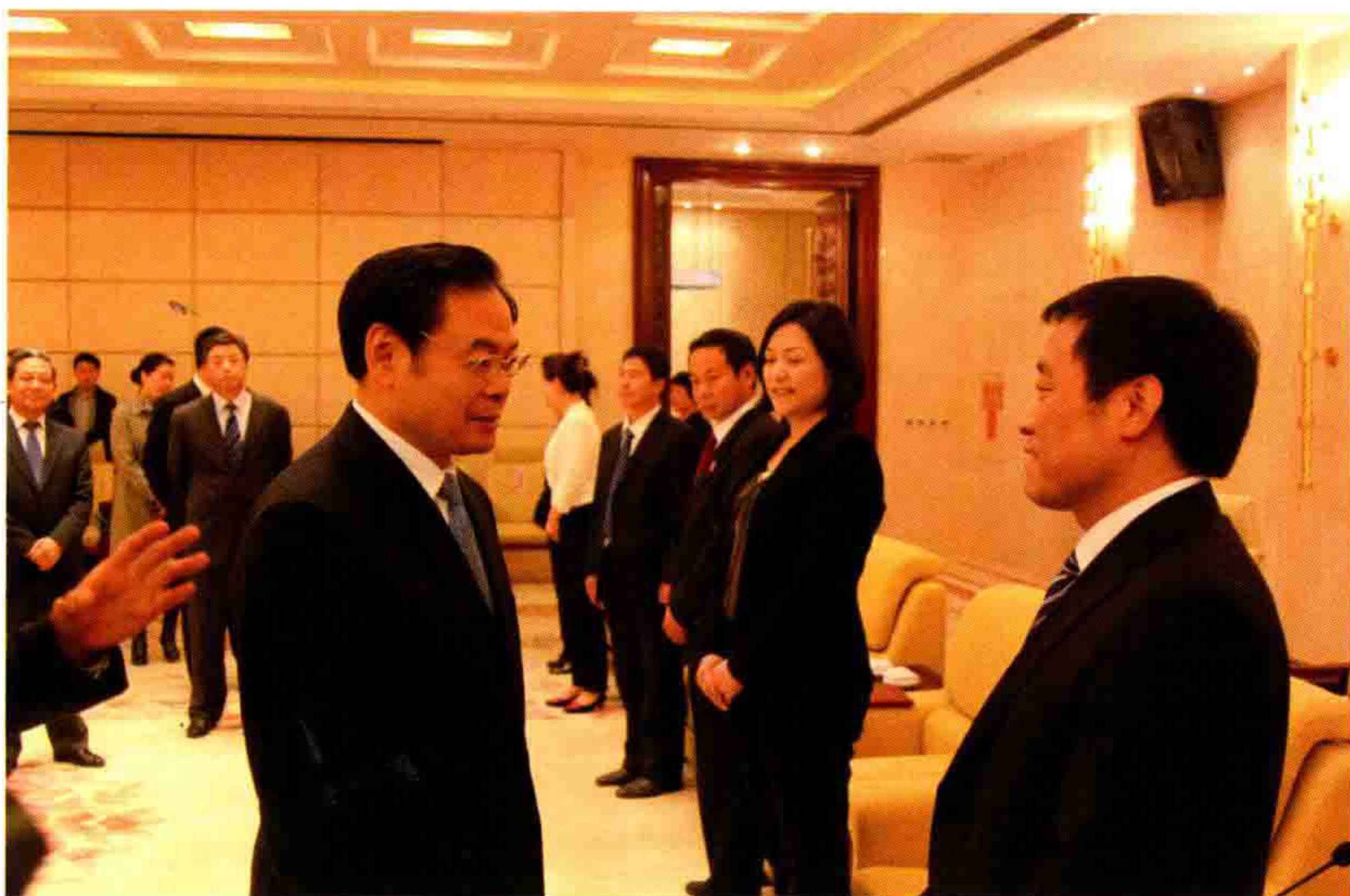
◎ 李万升受到时任吉林省委书记王儒林的亲切接见