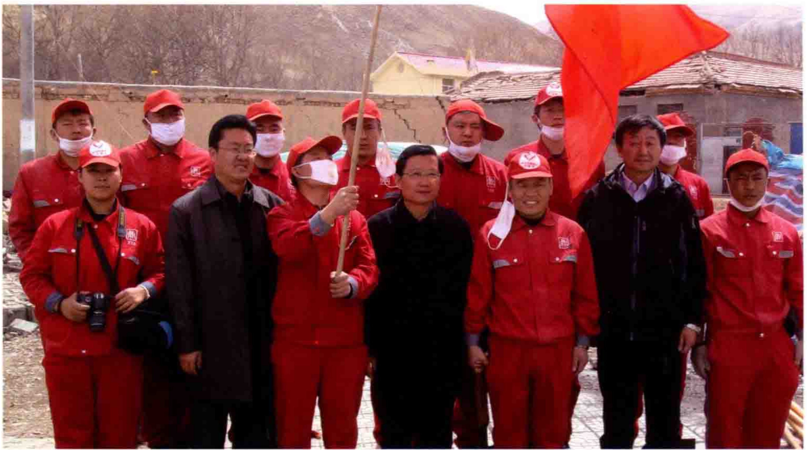
◎ 原青海省委书记强卫与鼎庆志愿者玉树合影