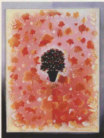
L, 80 cm x H, 99 cm, 1998.