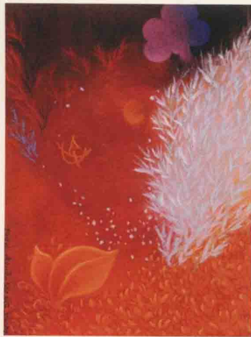
L. 28.5 cm x H. 38 cm. 1994.

(註一) 我想把瀟灑大師清到廿一世紀末， (註二) 日本當代著名的淨土學者：荒木見悟。