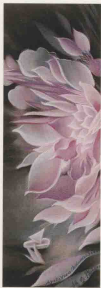
L, 20 cm x H, 57 cm, 2000,