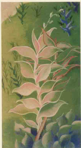
L. 27 cm x H. 57 cm. 1994.