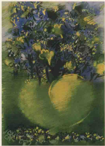
L, 26 cm x H, 36 cm, 1993.