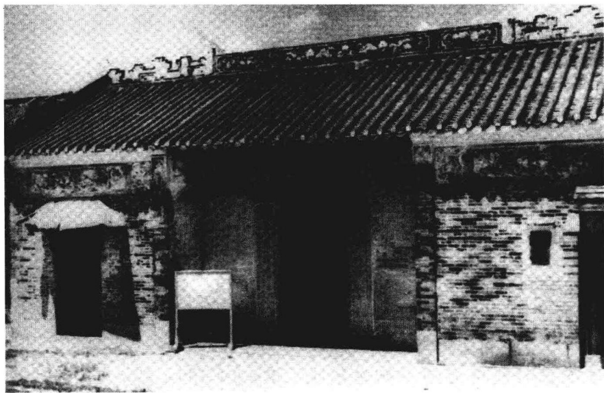
翠亨村的村庙——北极殿。孙中山就出生在庙南边的一个小院落里。

香山县位于广东珠江三角洲南部，濒临南海，南通澳门、香港，北通广州，交通非常便利，属于亚热带气候。相传香山二字是由于该县山中盛产沉香而得名。翠亨村是香山县东南部的一个小村落，村民以杨姓陆姓居多，姓孙的只有六七户，村中绝大多数土地集中在几户地主手中，如做过银行买办的陆仁东、贩卖猪仔的暴发户杨启，都拥有三百亩以上的土地。翠亨村土地多阡