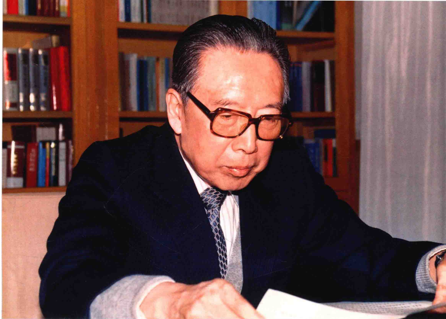
“勤于工作”——吴学谦在办公室（摄于1992年12月）。