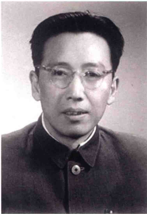
吴学谦在中联部（摄于20世纪60年代“文革”前期）。