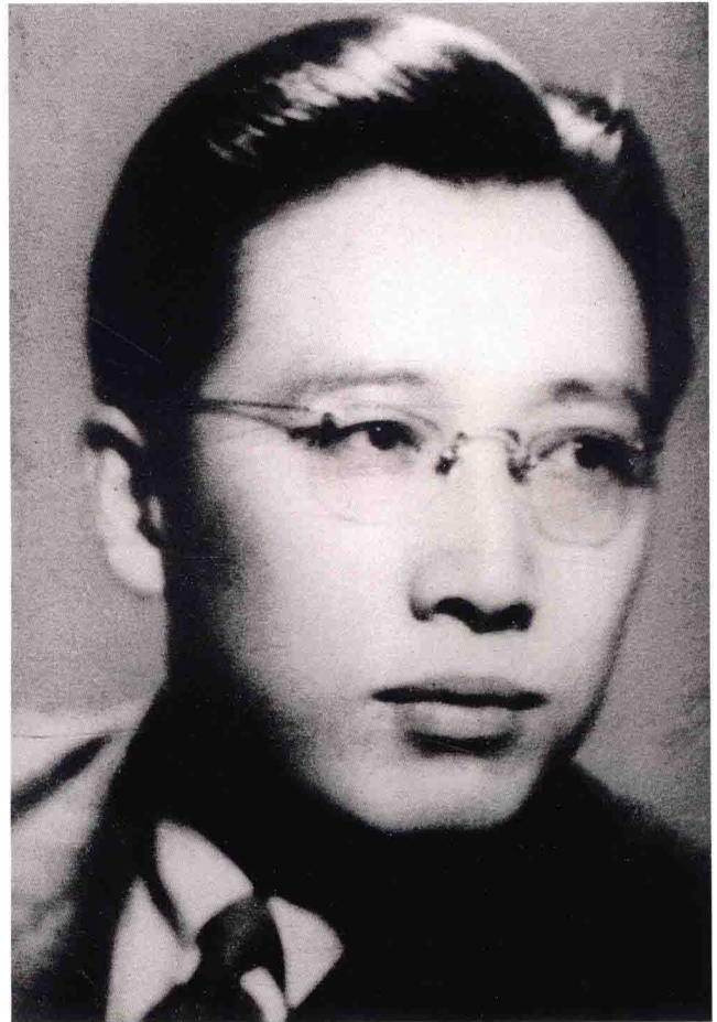
刚参加团中央工作时的吴学谦（摄于1950年）。