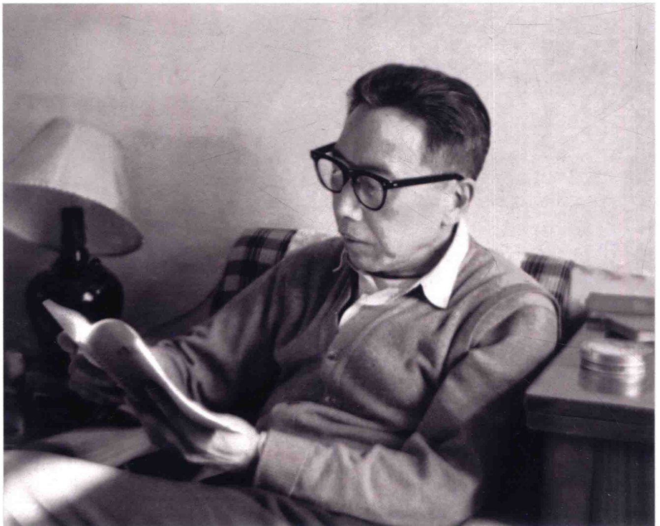
“勤学深思”——吴学谦在家中（摄于20世纪70年代）。