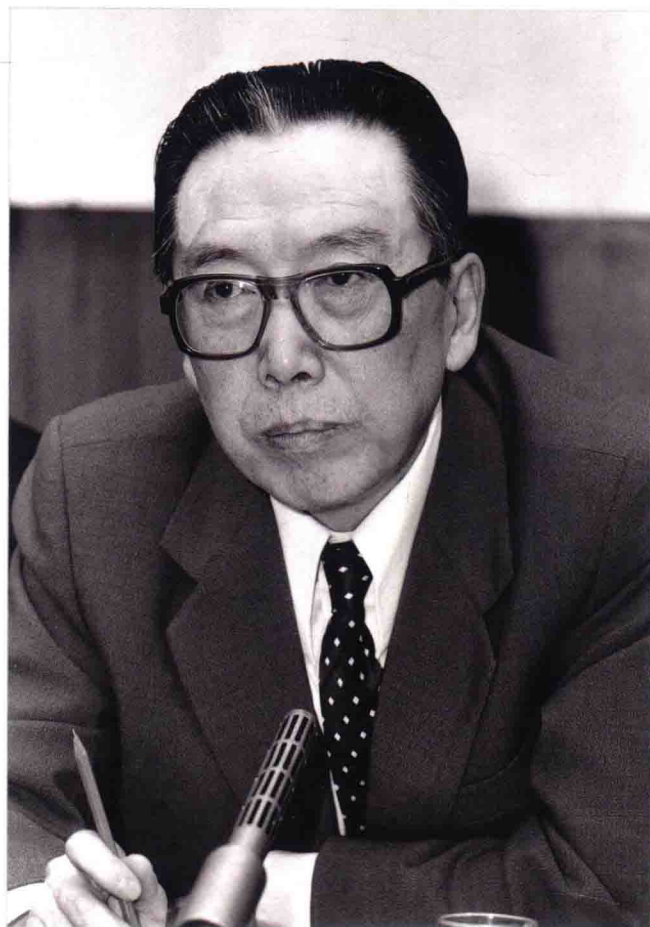
吴学谦在国务委员兼外长任上（摄于1984年）。