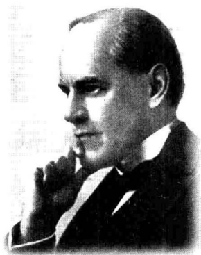
约翰·高尔斯华绥 像