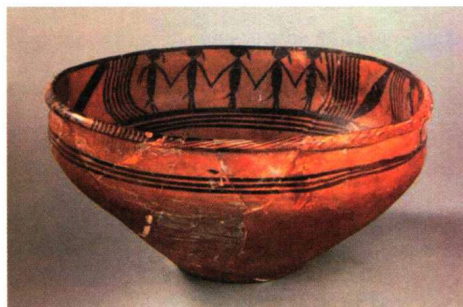
舞蹈纹彩陶盆 / 新石器时代 距今 5000 年 / 青海省大通县上孙家寨