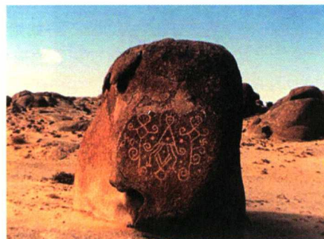
阴山岩画 三神像 / 新石器至青铜时代 / 内蒙古自治区 阴山山脉