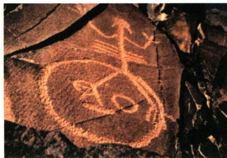
阴山岩画 巫师与人面像 / 新石器至青铜时代 / 内蒙古自治区 阴山山脉