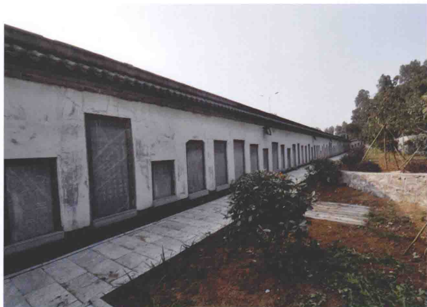
当代“卧龙碑林”外景