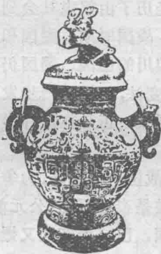
铜罍（彭县竹瓦街出土）

巴、蜀境内的少数民族 古代四川是一个多民族杂居的地区。在巴族居住地区，除巴族和很早即定居于此的中原民族外，还有其它许多民族。《华阳国志·巴志》记载：“其属有濮、賨、苴、共、奴、獯、夷、蜃（yǒn）之蛮。”蜀地也是如此，据《史记·西南夷列传》记载：蜀的南边（今宜宾地区）有僰（Bó）族，蜀的西南（今西昌地区）有邛都，蜀的西边（今雅安地区）有徙和笮（zuò）都，今阿坝地区有冉駹（máng）。巴蜀境内众多的少数民族，在创造四川古代文化，推动社会进步中都作出了贡献。