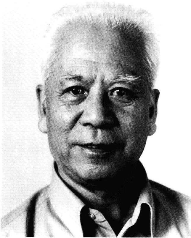
作者像 (20 世纪 80 年代)