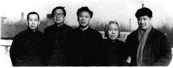
与丁玲（左四）、陈明（左一）夫妇。（20世纪70年代末）