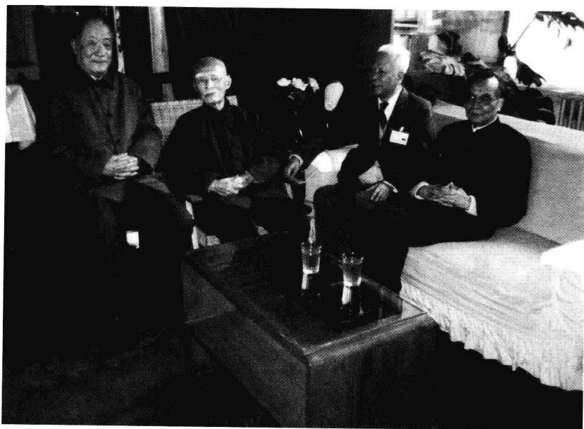
看望叶老。左起：刘白羽、叶圣陶、姚雪垠、林默涵。（1987）