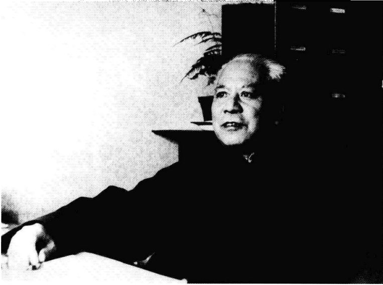
《李自成》第三卷完成时。(1980)