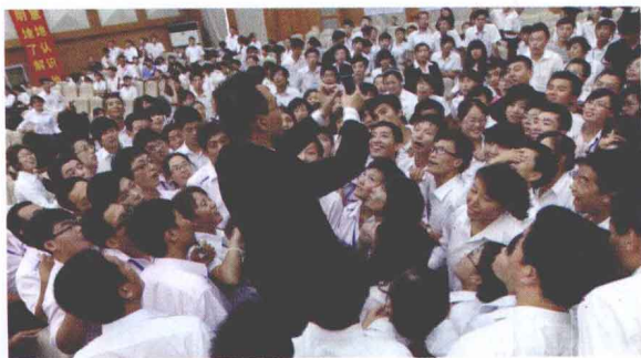
▲ 难以想象 无法描述