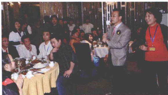
▲ 同甘共苦 荣辱与共