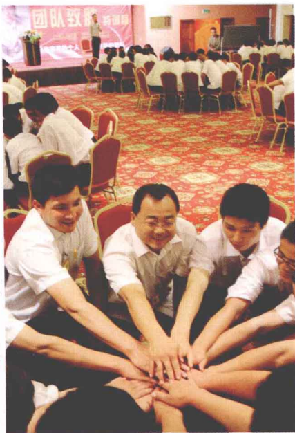
▲ 融入组织 体现价值