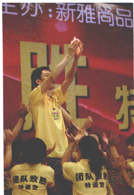
▲ 点一盏灯 将心照亮