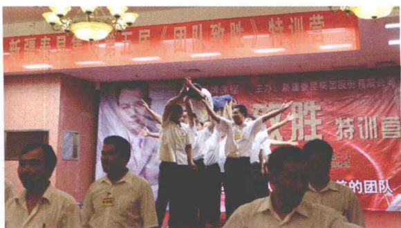
▲ 锁定目标 扬帆起航