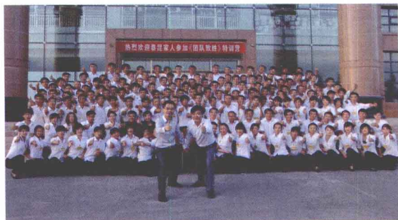
▲ 挽臂同行 把肩同乐