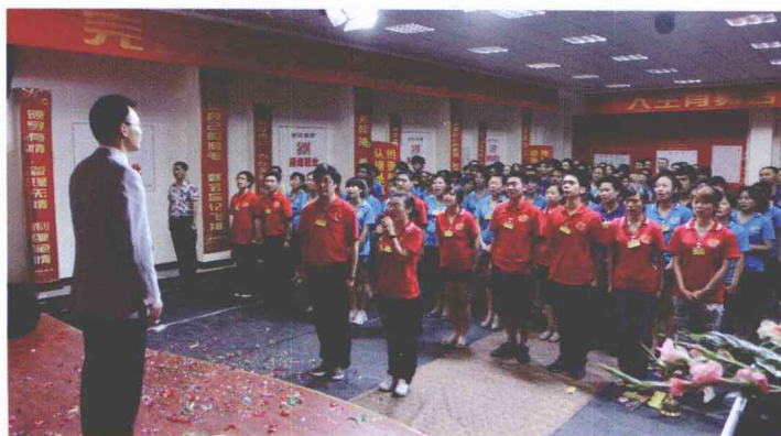
▶ 成都顺煌鞋业有限公司