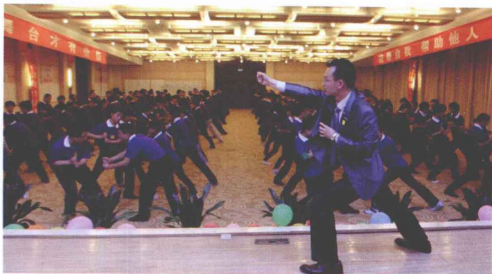
▶ 聊城鑫泰机床有限公司