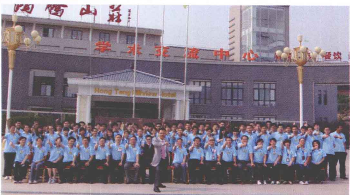
▶ 山东得安信息技术有限公司