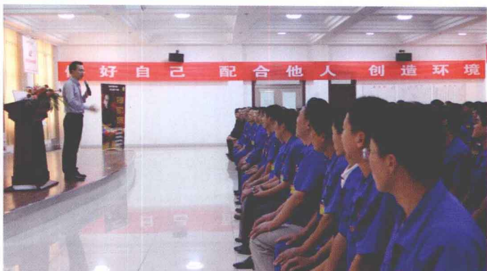
▶ 河南利源煤焦集团