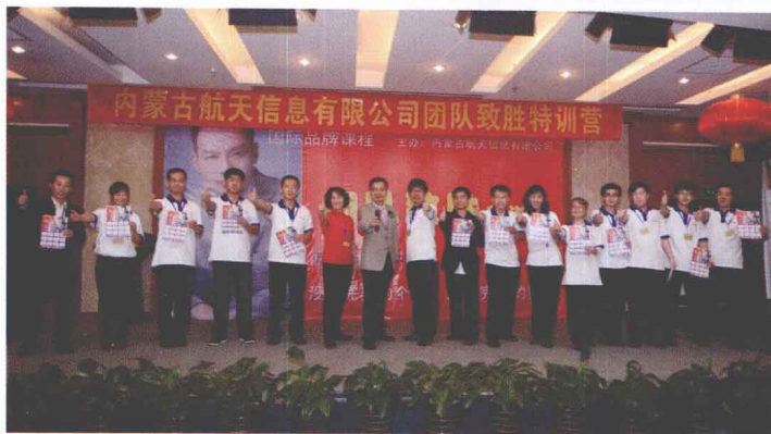
▶ 内蒙古航天信息有限公司