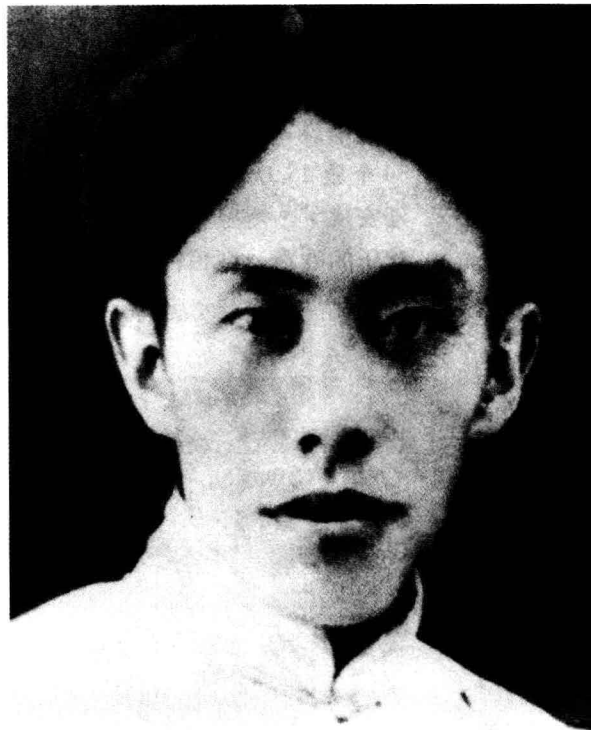
△ 刘志丹，陕甘革命根据地主要创始人之一。