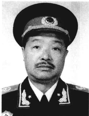
★ 贺 龙

湖南湘潭人。1916年入湘军。1922年考入湖南陆军军官讲武堂，毕业后在湘军任营长、团长，参加了北伐战争。土地革命战争时期，任中国工农红军第5军军长，红三军团总指挥及军团前委书记，中革军委副主席，东方军司令员，陕甘支队司令员，红一方面军司令员，红军前敌总指挥等职。抗日战争时期，任八路军副总指挥。1940年指挥百团大战。解放战争时期，任中央军委副主席、总参谋长，解放军副总司令，第一野战军司令员兼政治委员。1955年被授予元帅军衔。