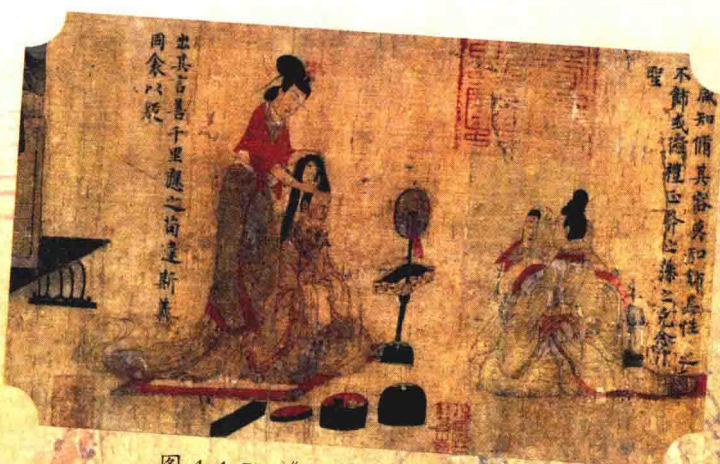
图 1.1.5 《女史箴图》(局部三)

善保管。为减少开卷,大英博物馆将《女史箴图》拦腰裁为两截,裱在板上悬挂,致使画卷损坏严重。由于相关知识的欠缺,《女史箴图》在重新装裱时,明清时期文人留下的题跋全都被无情地剪掉。更为可惜的是,被基勇松盗往英国的《女史箴图》原有十二段,但因年代久远,目前仅存九段(图 1.1.3-图 1.1.5)。