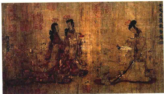
图 1.1.1 《女史箴图》(局部)