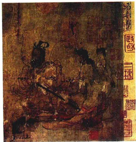
图 1.1.2 历代印章

《女史箴》11行。此后，唐摹本《女史箴图》又在金代和明代的宫廷中收藏。明代中期，这件国宝流到宫外，被鉴赏家项子京等文人收藏。清代以后，它重新回到宫中。乾隆皇帝把《女史箴