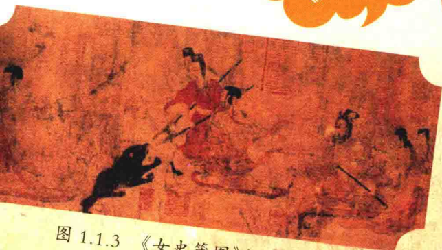
图 1.1.3 《女史箴图》(局部一)