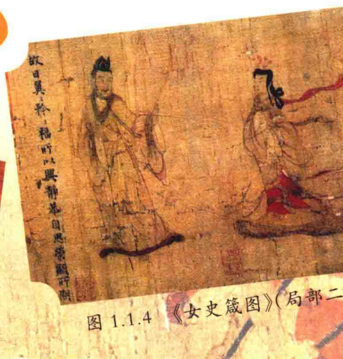
图 1.1.4 《女史箴图》(局部二)