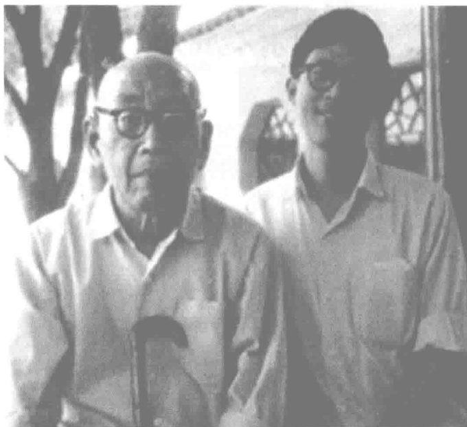
1974年秋与吾师俞剑华老教授合影

我从小喜爱绘画。记得在中学时，教我们语文的宋老师出了一道作文题《我的理想》，我写的是将来想当一名画家，乘着飞船，遨游太空，将所见最美好的事物画下来，因为写得很有激情，被老师当成范本在课堂上朗读了，无疑增添了我学画之信念。1958年江苏省泰兴中学高中毕