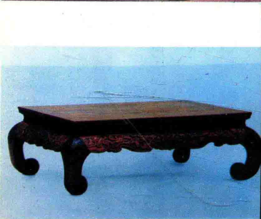
图2-5 明黄花梨有束腰鼓腿形鼓牙坑桌