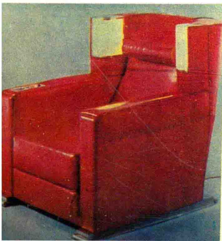
图3-6 赫尔曼·穆特修斯设计的装有 阅读灯的沙发