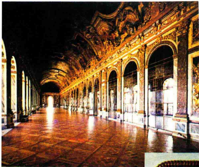
图3-4 凡尔赛宫内装饰