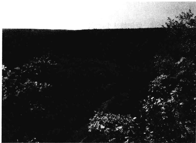
△ 贺英出生地洪家关

因为家境贫困，香姑没有上学，香姑也渴望读书识字，可她很懂事，从不向父母提起，她心里很清楚，家里穷，吃饭都吃不饱，哪有钱让她去读书。她家隔壁邻居，是一位清朝的老秀才，老秀才时常教自己的小孙子读书识字，她有空就过