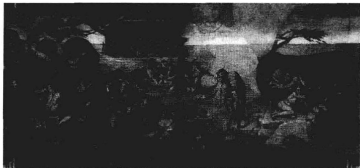
壁画《大洪水》。看着这些由于受磨难而表情滞重的人物向前进，我们几乎能感觉到上帝愤怒时的恐怖气氛。

就在这时，天降大雨，洪水从地底下喷了出来，淹没了房子和高山，一直向神仙的住所奔涌而去。天神一看洪水已经涌上了天门，说不定什么时候就淹没了天庭，就命令雷公赶紧退水。雷公应声就去退水，结果洪水瞬间就退到了海里。坐船避难的父亲一下子从空