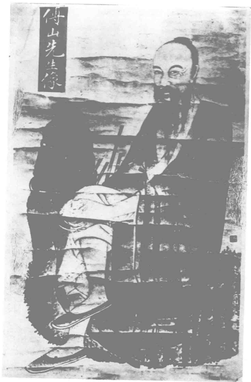
傅山 (1607—1684) (太原常清文先生家藏)