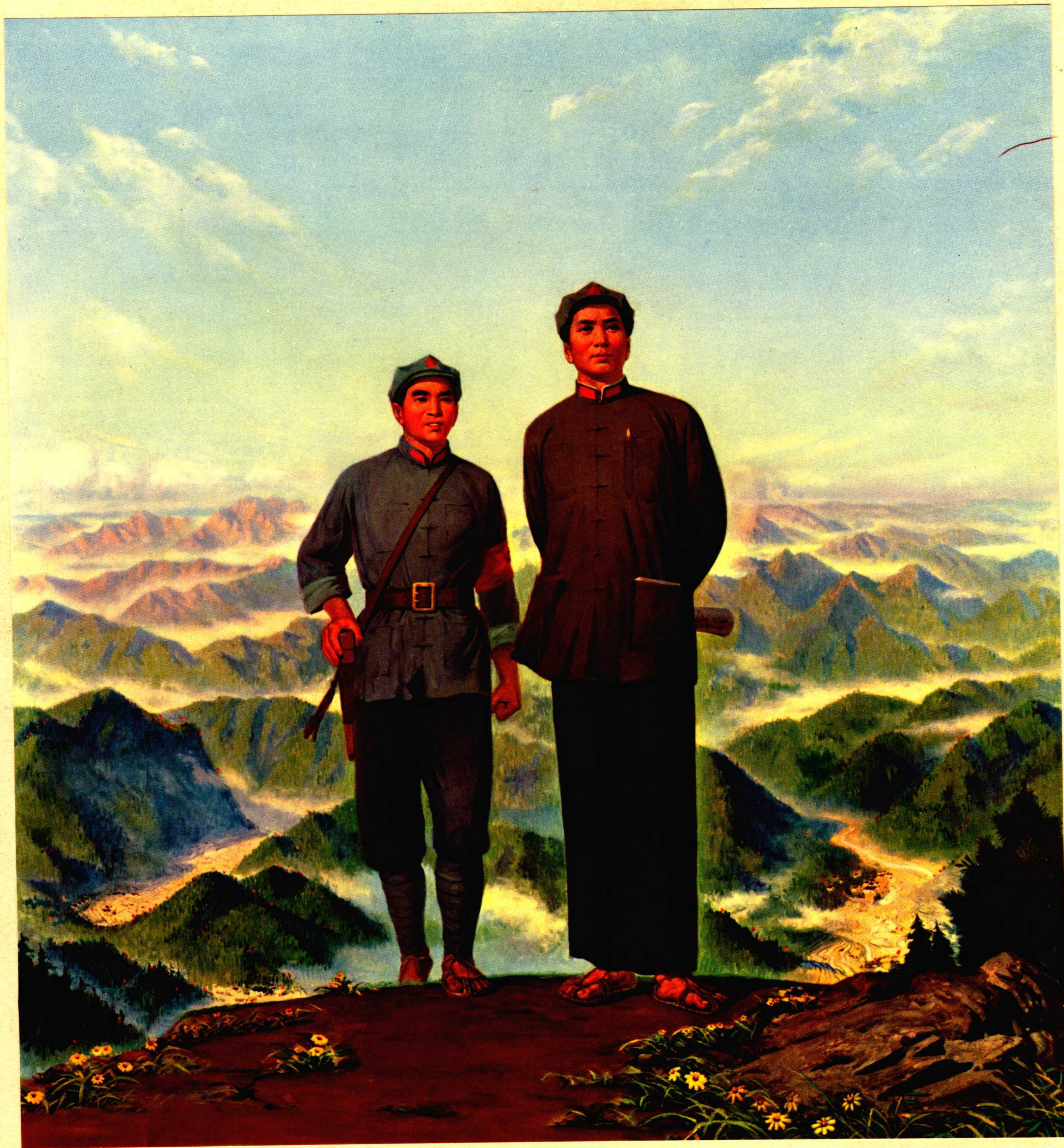
伟大统帅毛主席和他的亲密战友林彪副主席在井冈山（油画）