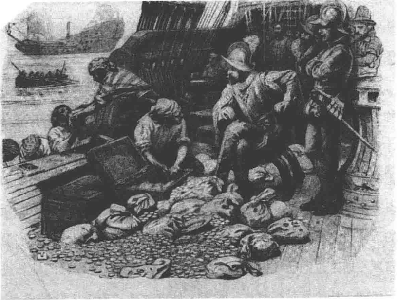
德雷克正在查看从西班牙船上劫来的财宝