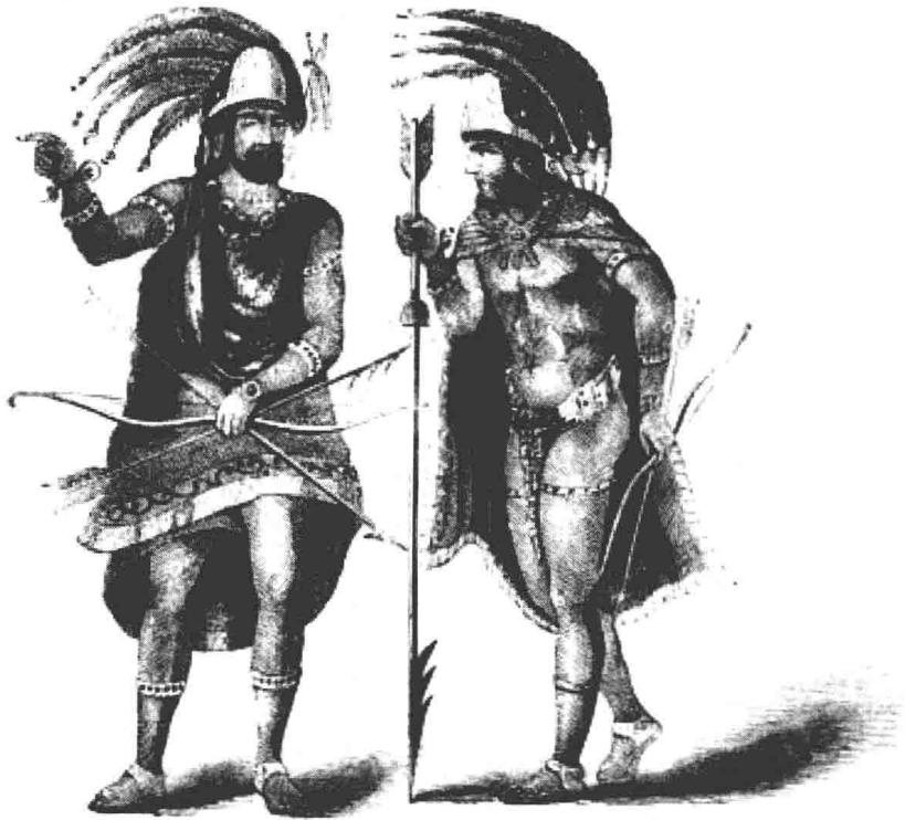
阿兹台克人以及他们的头盔、盾牌和羽毛斗篷