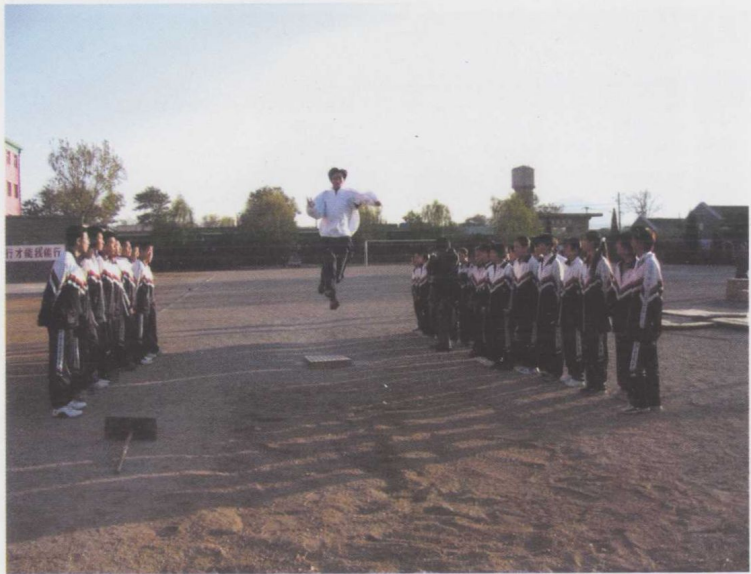
培训学员授课示范动作