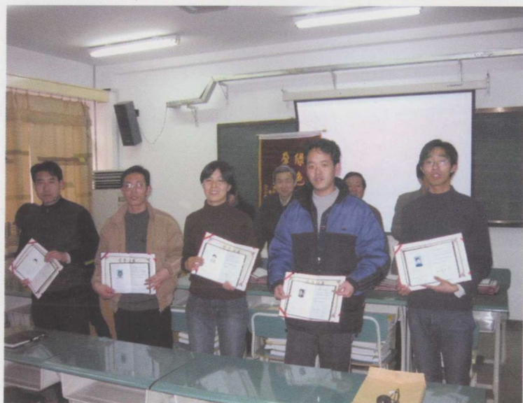
学员成果资源包与证书