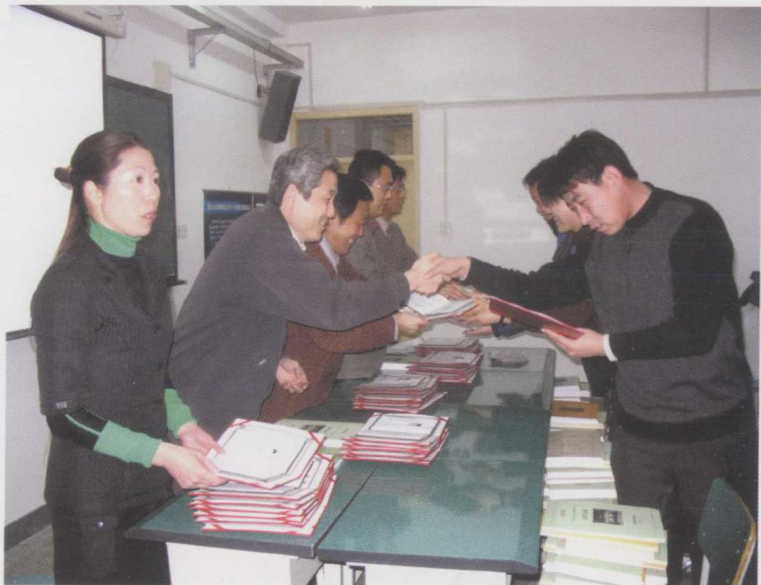
结业典礼领导颁发证书