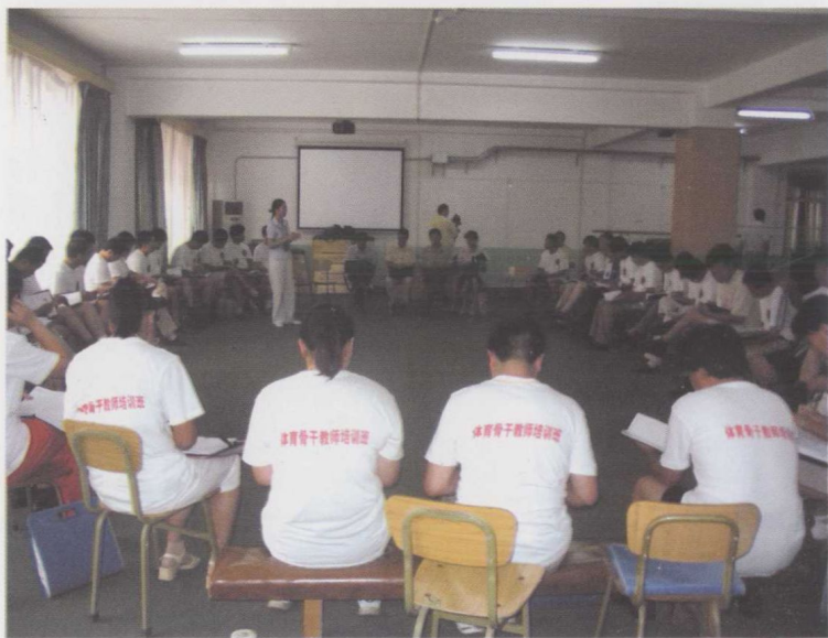
与特级教师互动交流