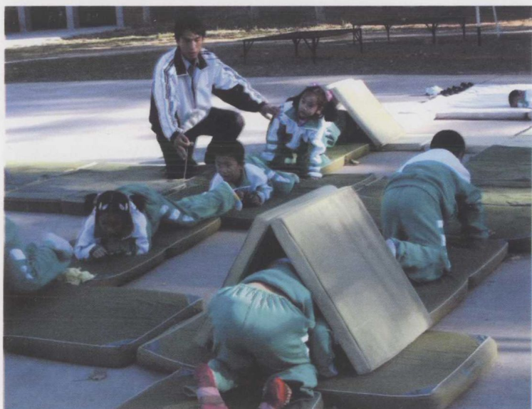
“快快爬到他的家”爬行运动