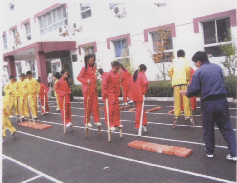
满族传统体育项目踩高跷