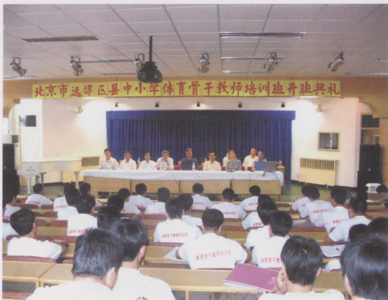
中小学体育骨干教师培训班开班典礼