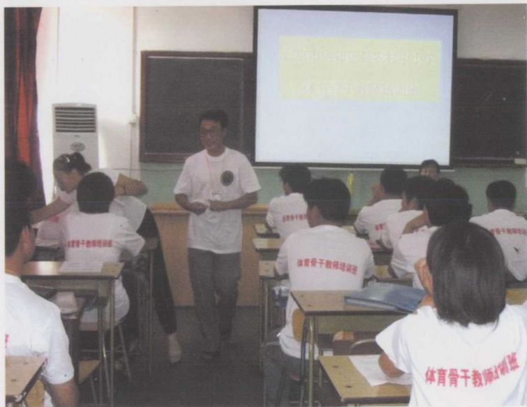
学员自我介绍与互动交流