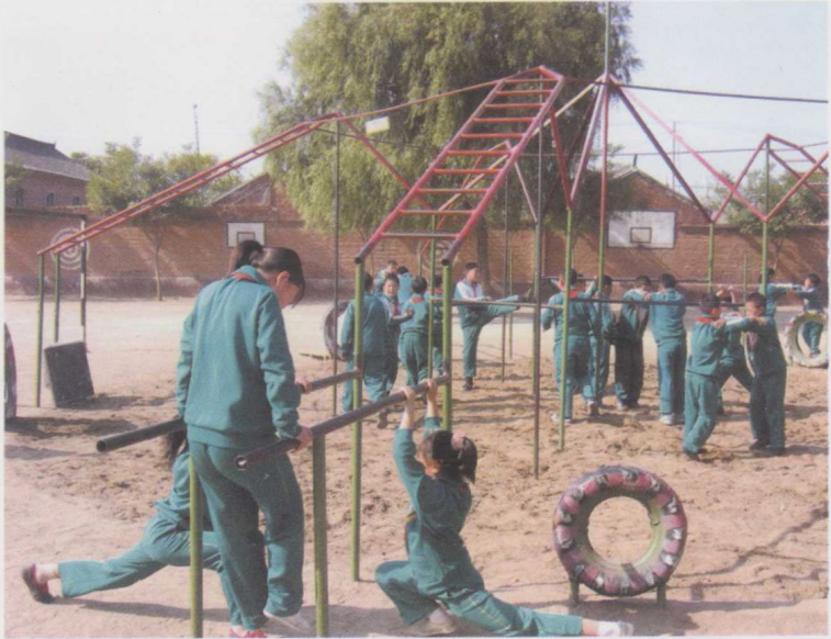
学员自制联合器上课