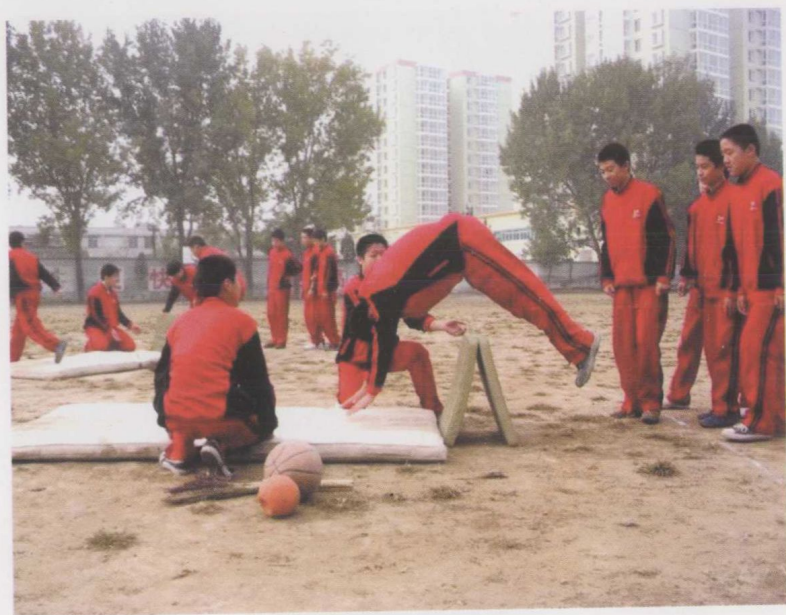
小组合作学练鱼跃前滚翻