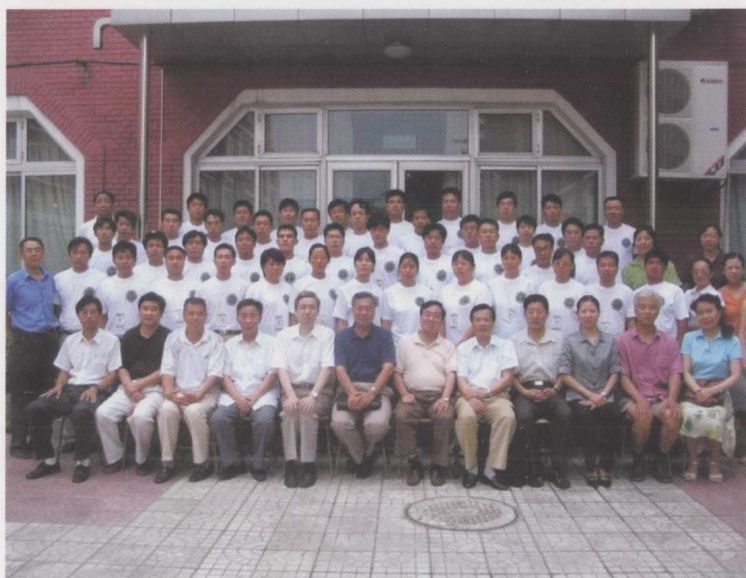
首期“绿色耕耘”体育骨干班合影