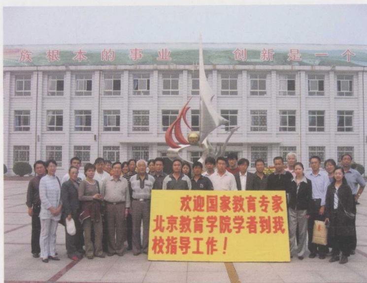
骨干班学员赴天津观摩考察