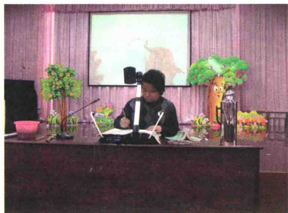
专家培训——教师素养提高