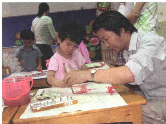
专家引领——实践中的指导