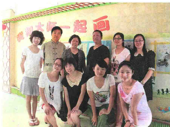
国画课题项目组成员