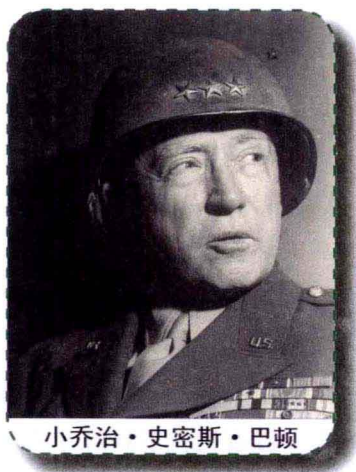
小乔治·史密斯·巴顿

这一仗打得实在太差，第1步兵师的后代们将其前辈的脸都给丢尽了。第1步兵师没有把仗打好，它的上级，美第2军军长也难逃干系，被盟军最高司令艾森豪威尔撤了职，并任命巴顿为新军长，副军长则是另外一位美军名将布莱德利。当第1步兵师垂头丧气地出现在布莱