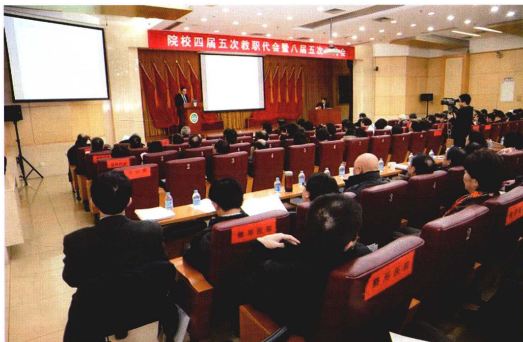
2013年3月1日四届五次教职代会