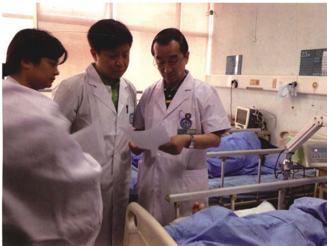
2013年4月21日雅安地震后院校专家赴前线