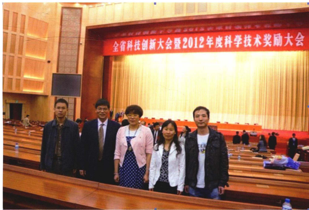
2013年5月23日云南省人民政府召开2012年度科学技术奖励大会