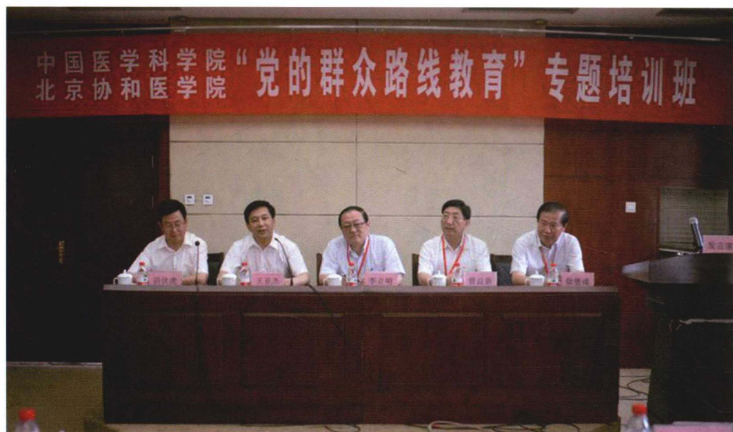
2013年6月14日“党的群众路线”专题研讨班