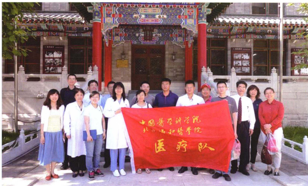
2013年5月29日院校援藏医疗队座谈暨欢送会