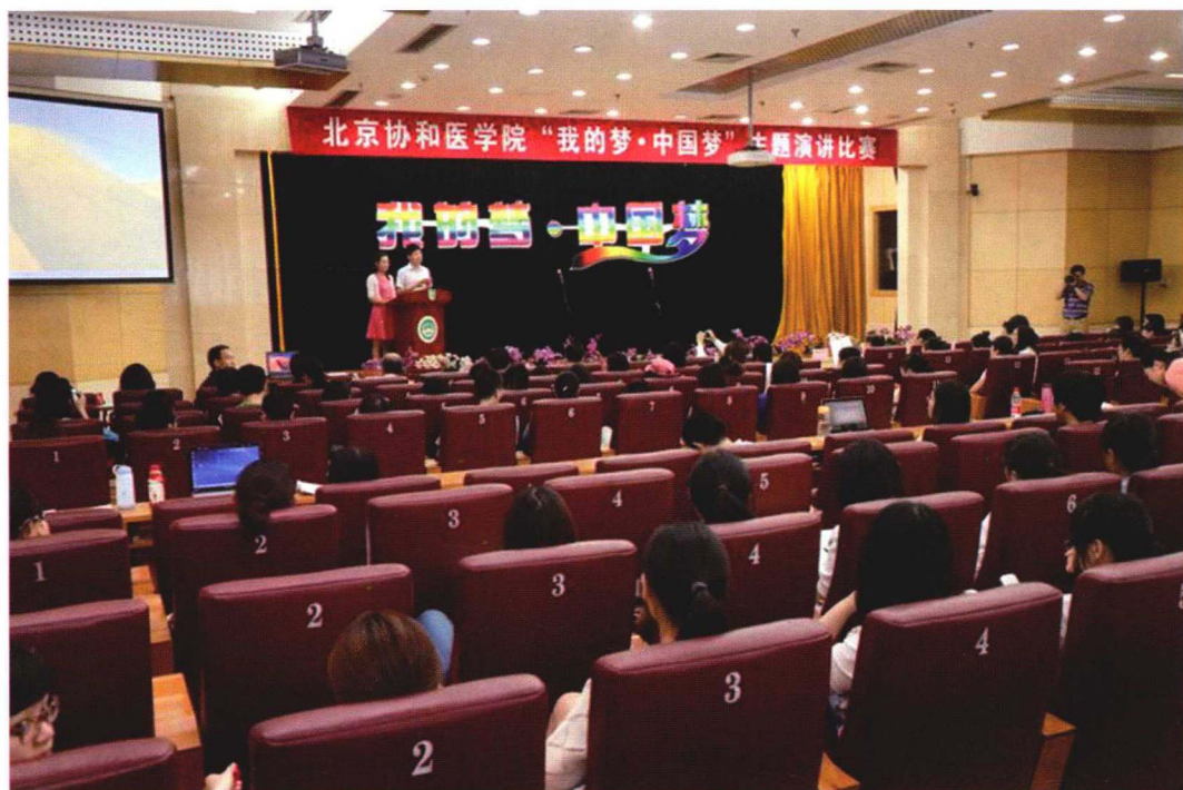
2013年5月14日“我的梦·中国梦”演讲比赛