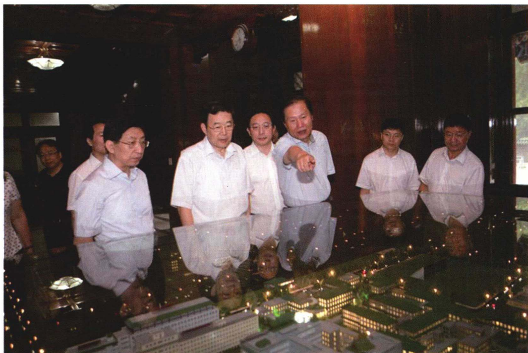
2013年7月1日卫计委孙志刚到院校调研