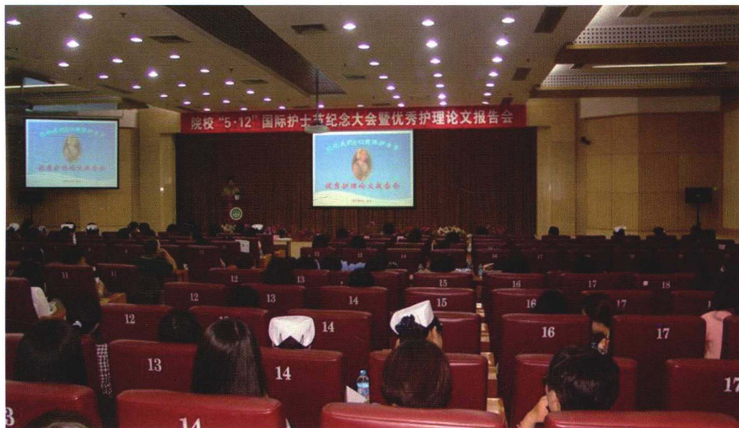
2013年5月17日院校512国际护士节