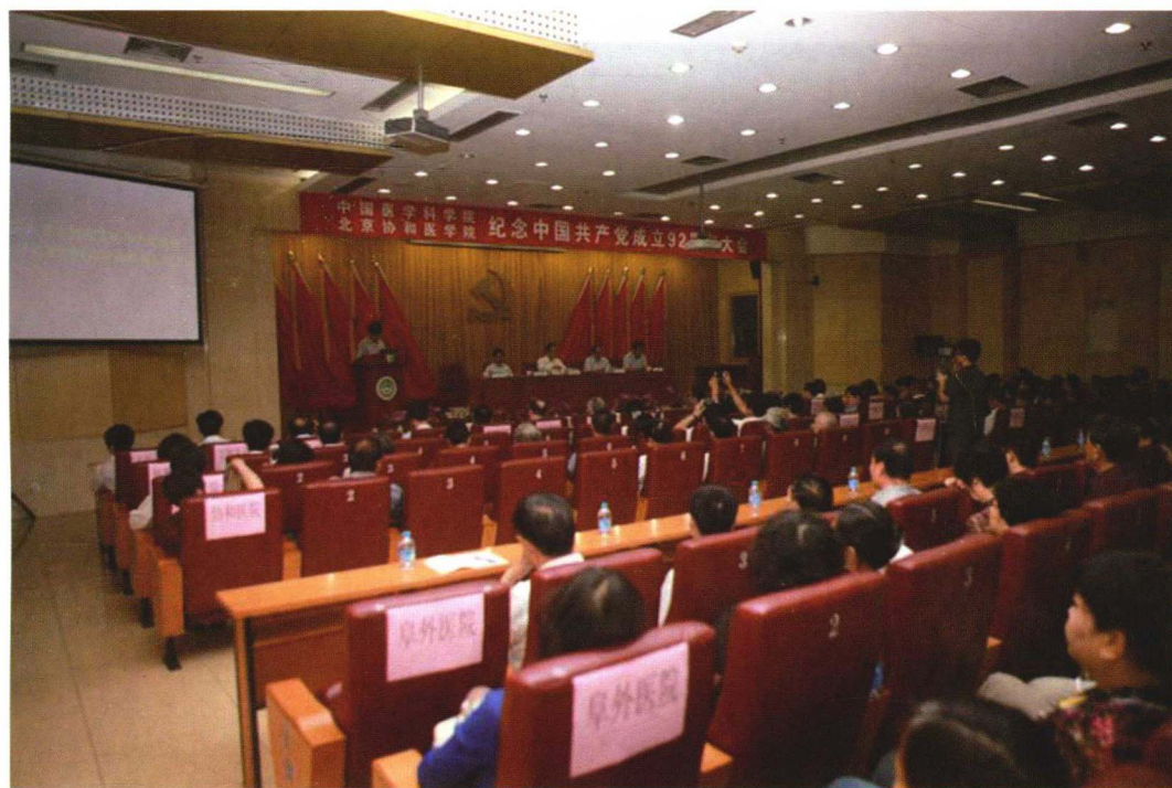
2013年7月1日纪念中国共产党成立92周年大会