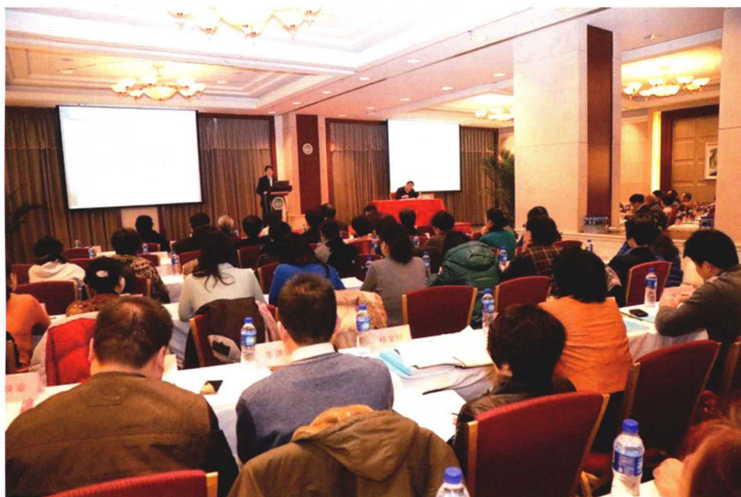
2013年1月23日院校党建和反腐倡廉工作会