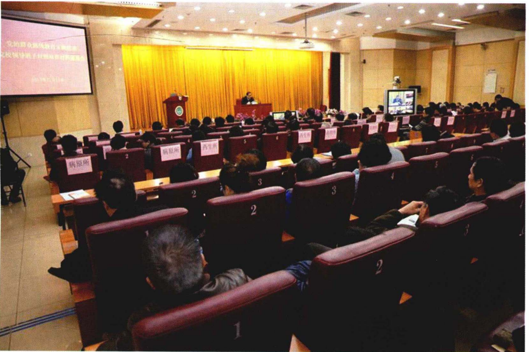
2013年11月13日领导班子对照检查材料通报会