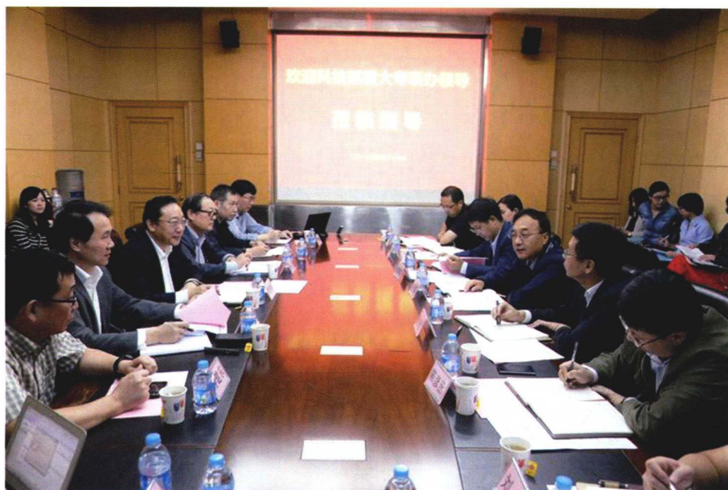
2013年9月27日科技部重大专项办公室来院校调研