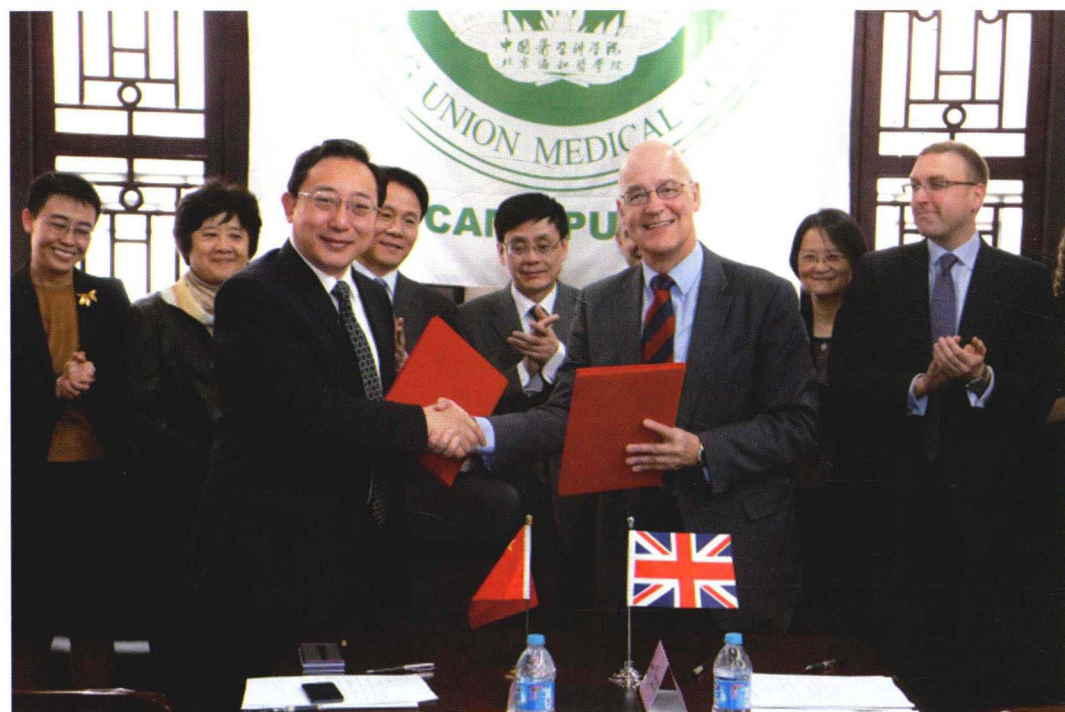
2013年4月2日与牛津大学签署合作备忘录