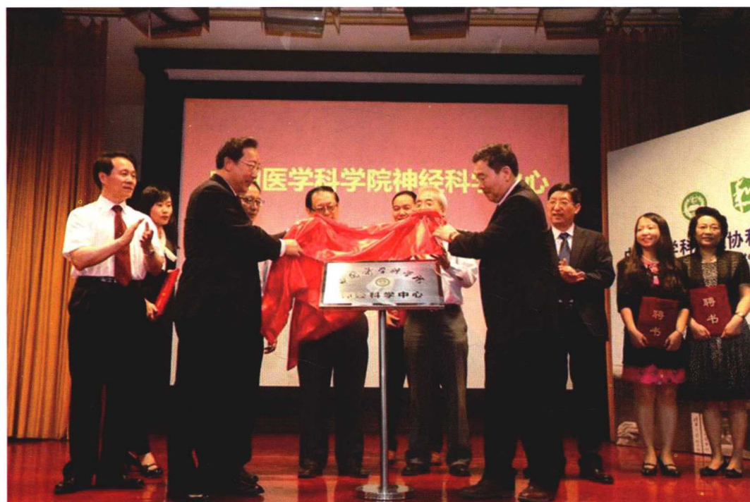
2013年5月15日神经科学中心揭牌