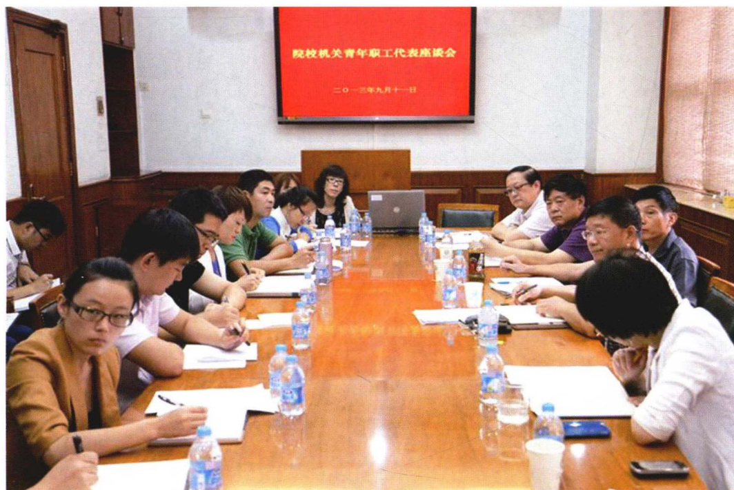
2013年9月11日青年职工座谈会