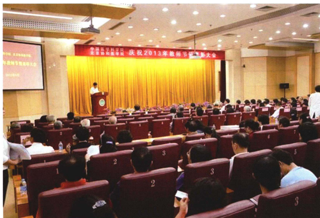
2013年9月9日教师节表彰大会