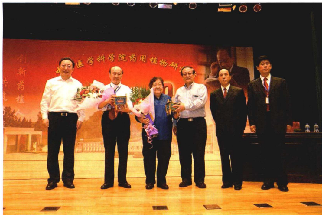
2013年9月22日肖培根院士从业60周年暨建所30周年药植论坛在京举行