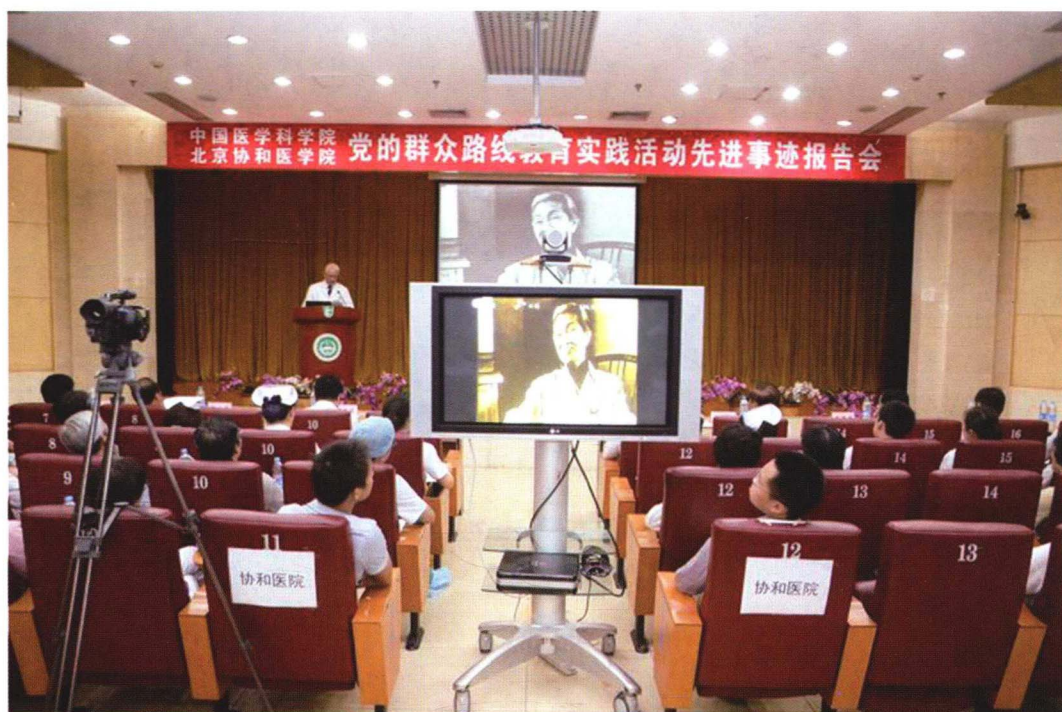
2013年9月4日院校党的群众路线教育实践活动先进事迹报告会