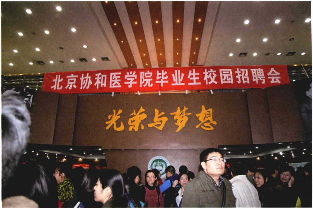
2013年11月22日北京协和医学院首场2014年毕业生招聘会