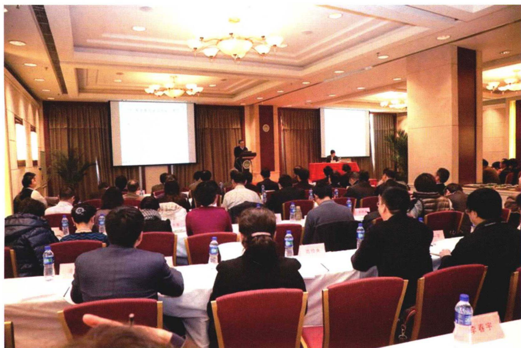
2013年1月21日院校工作会