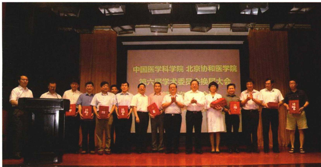
2013年6月27日院校第六届学术委员会换届大会暨第一次全体会议