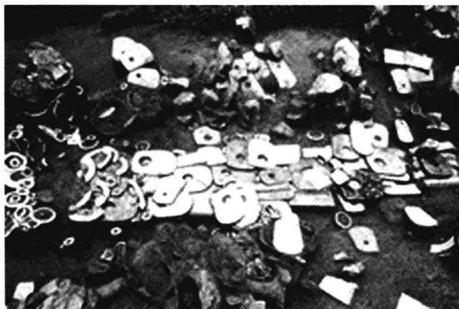
凌家滩遗址大墓精美玉器

位于六安城东、被孔子尊为与尧舜禹齐名的“上古四圣”之一、堪称中华法制鼻祖的皋陶的墓葬,以及肥西县大墩子,含山县大城墩、孙家岗,肥东县吴大墩等多处商周以淮夷文化为主体的遗址,这些星罗棋布的遗址