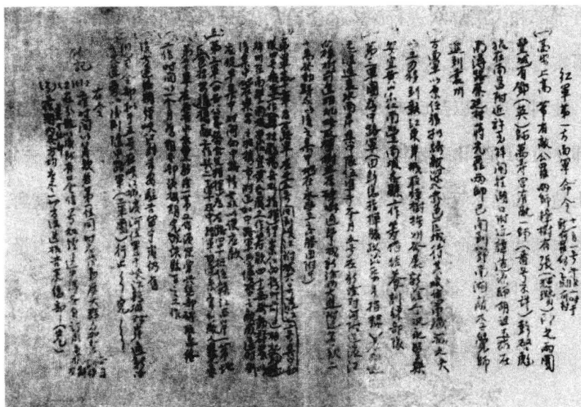
1930年11月1日红一方面军发布的“诱敌深入”准备反“围剿”的命令

靠苏区军民的支援，选择有利于红军作战的战场，集中兵力适时反攻，歼敌于运动之中，以粉碎敌人的“围剿”。经过讨论，10月30日，总前委在罗坊会议上通过了“诱敌深入”的战略方针，决定红军主力东渡赣江，在地形、群众条件都比较好，便于日后发展的赣江以东地区作战。根据这一方针，中央苏区党、政、军、民迅速行动起来，进行政治动员，实行坚壁清野，做好了支援红军作战的准备。