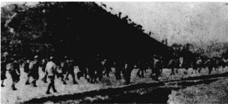
1930年11月至1931年初，国民党政府以10万兵力对中央革命根据地发动第一次军事“围剿”。图为进犯根据地的国民党军队

11月上旬，鲁涤平下令第十八师、新编第五师沿赣江西岸继续向前推进。敌人的行动开始后，红军还是在有计划地主动撤退。于是，第十八师一枪没放就进入新淦、永丰；新编第五师开进清江、新喻、峡江，均没有发现红军的踪迹。