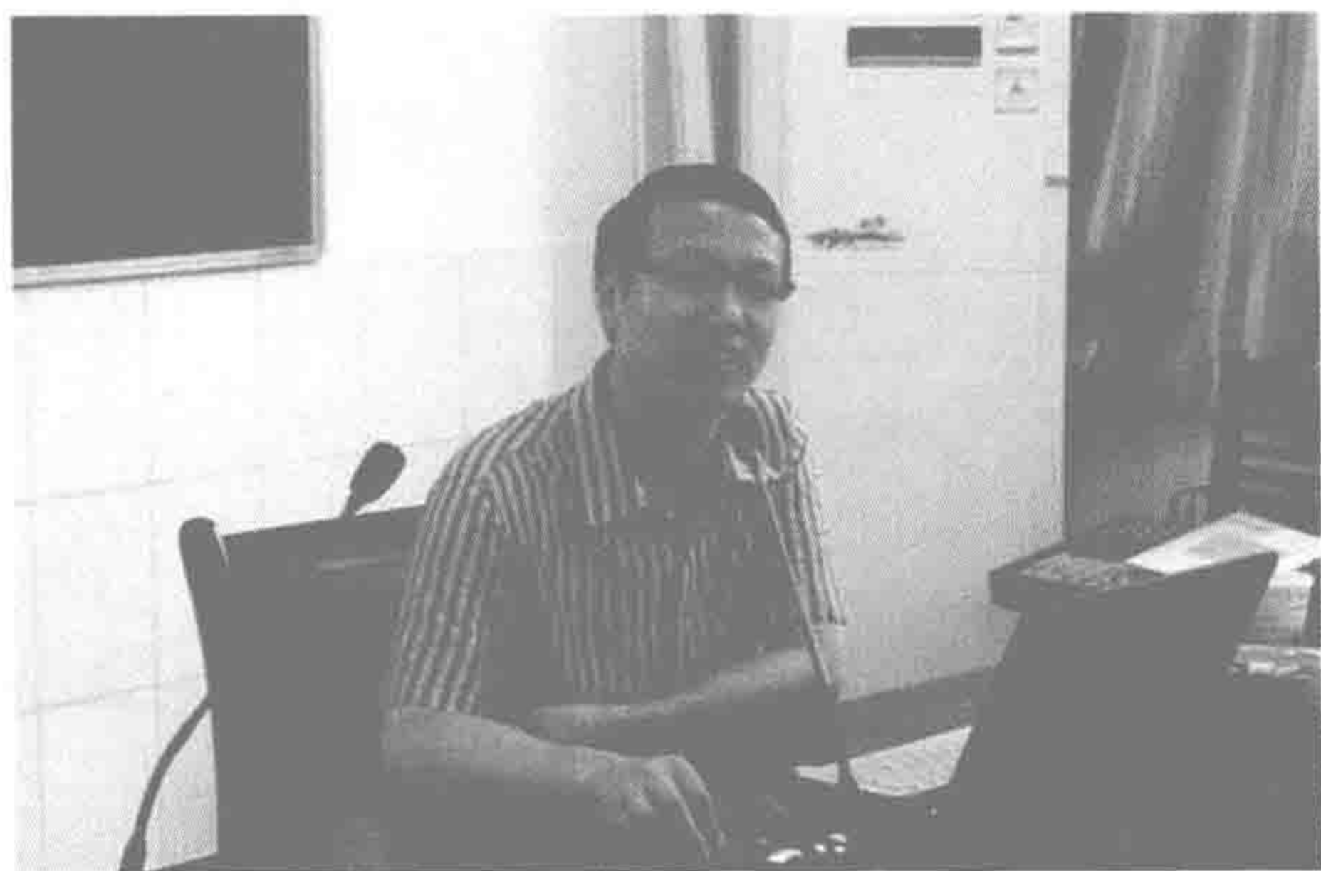
2010年8月在兴化市景范学校做学术讲座