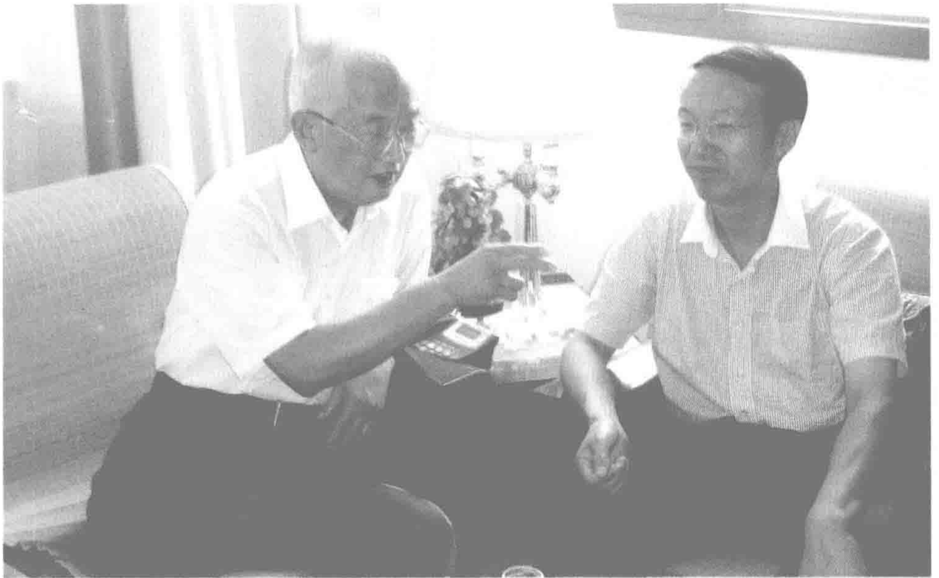
2011年教师节与著名语文特级教师柳印生先生在一起