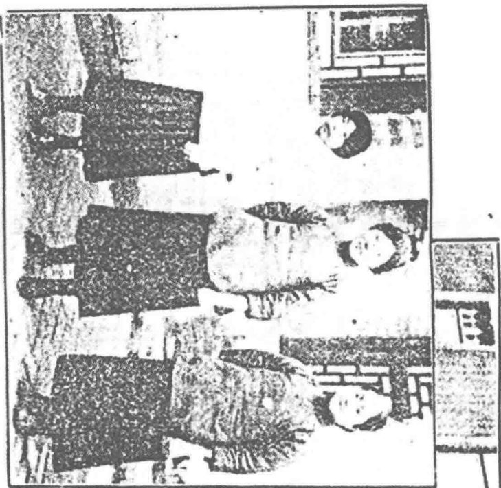
王蘭女 奚漬女 查曉女園