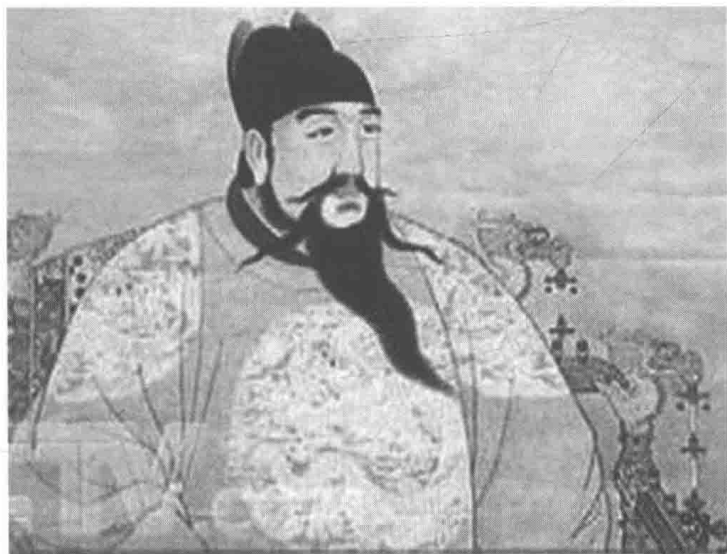
明朝开国皇帝朱元璋

明王朝是在推翻元朝统治的基础上建立起来的。在蒙古贵族的统治下,元朝末年,社会经济已经濒临崩溃。因此,朱元璋建立明朝后,推行了一系列政策,大力发展社会经济。首先,他以空前的严厉手段,处死了一大批贪官污吏,兴起了一场廉政风暴,既在政治上巩固了自己的统治,又为明初社会经济的恢复和发展创造了有利条件。其次,采取了移民屯田、开垦荒地的农业政策,积极鼓励恢复和发展农业生产。第三,朱元璋也推行了一系列诸如减轻商税、放宽对工匠的限制、统一钱币等对工商业有利的政策。因此,明初社会经济很快得到恢复。朱元璋死后,后继的几位皇帝也基本上能遵循祖制,继续发展社会经济,所以经过七八十年的休养生息,到了明代中叶社会经济有了长足的发展。