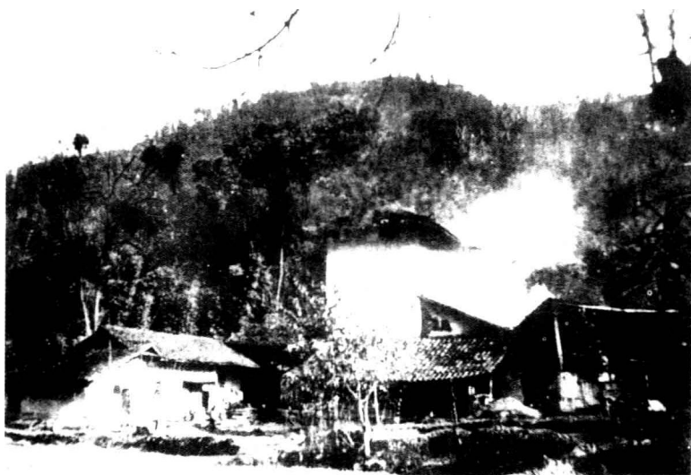
四川省仪陇县马鞍场琳琅寨李家塆。1886年12月1日，朱德诞生在这里的一个佃农家庭。