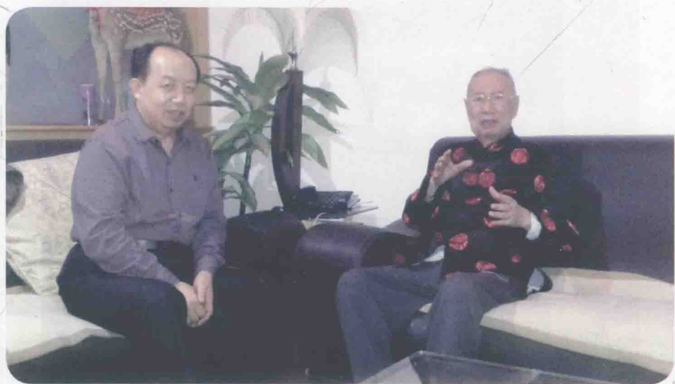
国医大师、河南中医学院原院长李振华教授（右）与韦绪性教授的合影