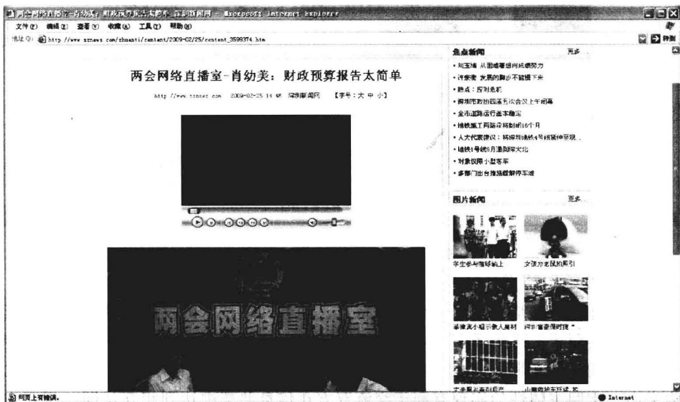
图 1-1-2 新浪网“两会网络直播室”

网络的出现使得新闻的时效性大大增强了,在网络上可以第一时间发布新闻信息,也可以第一时间更新、修改、删除已经发布的新闻,还可以在线直播。比如新浪网遇到球赛或者重大新闻事件时,往往就设立“网络直播室”,发布文字、图片和视频等即时新闻信息。(图 1-1-2)新闻发布时间观的发展变化,是中国网络新闻业务对于传统新闻业务改革的一个重要方面。传统新闻发布所遵循的一个原则是“定时”,而网络新闻则必须与时俱进,突破定时的限制,新闻报道不仅“及时”而且要尽可能做到“实时”。“实时”不仅是网络新闻追求的时效观,也是众多网站竞争的一个重要目标。网络新闻不仅要最大限度地保障对个别新闻事件报道的时效性,同时也要力争做到全天候报道,实现报道的“全时”目标。