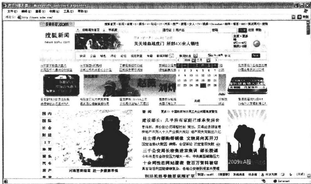
图 1-1-3 搜狐的“往日新闻回顾”

现。读者通过过刊查询和资料检索等能迅速地找到自己所需要的资料。一般大型的门户网站都有自己的搜索引擎,比如新浪、搜狐、雅虎等;很多新闻网站也有自己的内部新闻检索。比如人民网可以查阅《人民日报》报系的1995年1月1日以后的全部内容,新华网可以查阅2000年后的新闻资料,《中国青年报》可以在网上查阅2000年5月15日至今的报纸内容等。(图1-1-3)这些数据库的建设大大方便了我们的查询新闻资料。数据库具有格式规范性、数据集成性、专题性等特征,网络新闻编辑工作的重要内容之一就是规划新闻数据库、编辑数据库内容,对数据库信息服务方式进行设计。