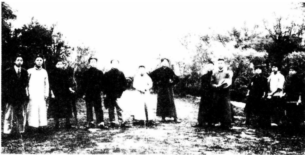
1920年5月8日，新民学会部分会员在上海半淞园合影，左七为毛泽东。

1915年，为征求志同道合的朋友，毛泽东拟一份征友广告在长沙的报纸上发表，署名“二十八画生”，因毛泽东三个字的繁体字是28画。广告中指明要结交能刻苦耐劳、意志坚定、随时准备为国捐躯的青年。毛泽东还把这份“二十八画生”启事在长沙的各个重要学校广为张贴。广告在报纸上发表后，“一共得到三个