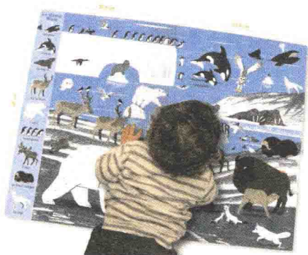
△孩子在阅读《地毯书》

从开本的角度看,儿童绘本又以16开为主流。书页如果过小,则不利于表现图画的细节;过大,则很难拿在手上,即使放在桌上也不够方便,在销售时还会受到书店里书架高度的制约。16开是绘本恰到好处的大小,既能完