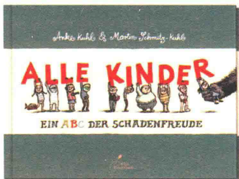
△柯莱特儿童出版社幽默绘本《所有的孩子》封面