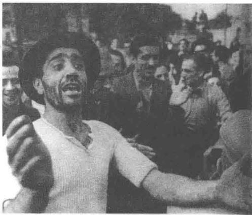
图 1.1 1943 年 7 月，西西里岛民众到勒莫市郊欢迎美军

太平洋海域。在“跳岛战术”的攻击下，日军被分割围困，后勤供应断绝，只得步步后撤。