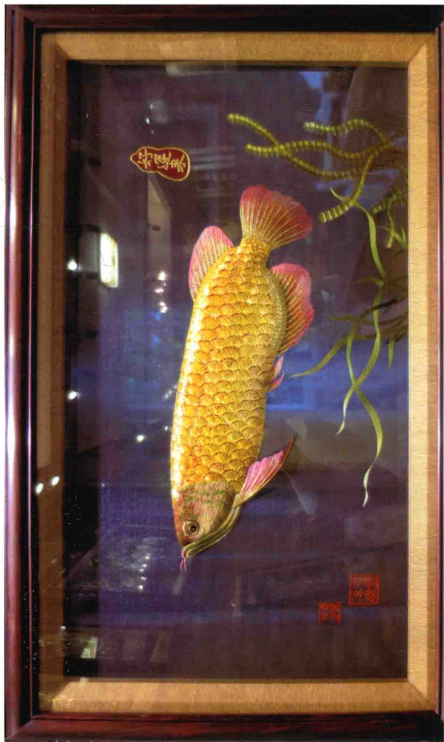
图 10 康惠芳大师潮绣作品：《好运来·金龙鱼》