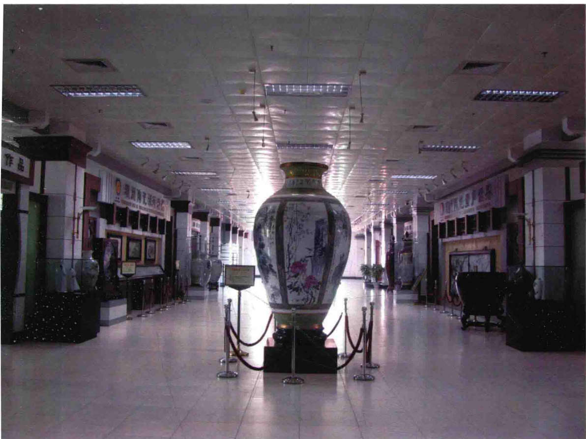
图1 潮州枫溪·中国陶瓷城展厅