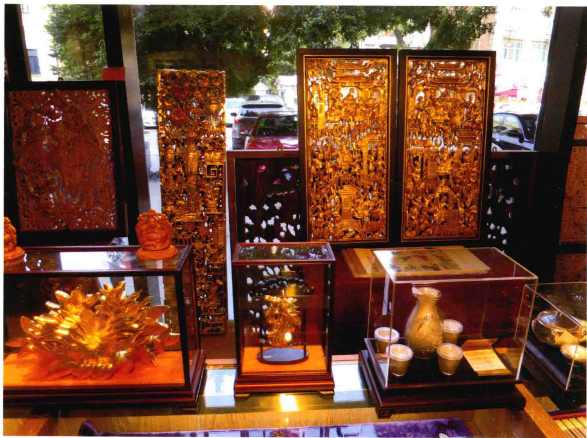
图 15 潮州金漆木雕作品