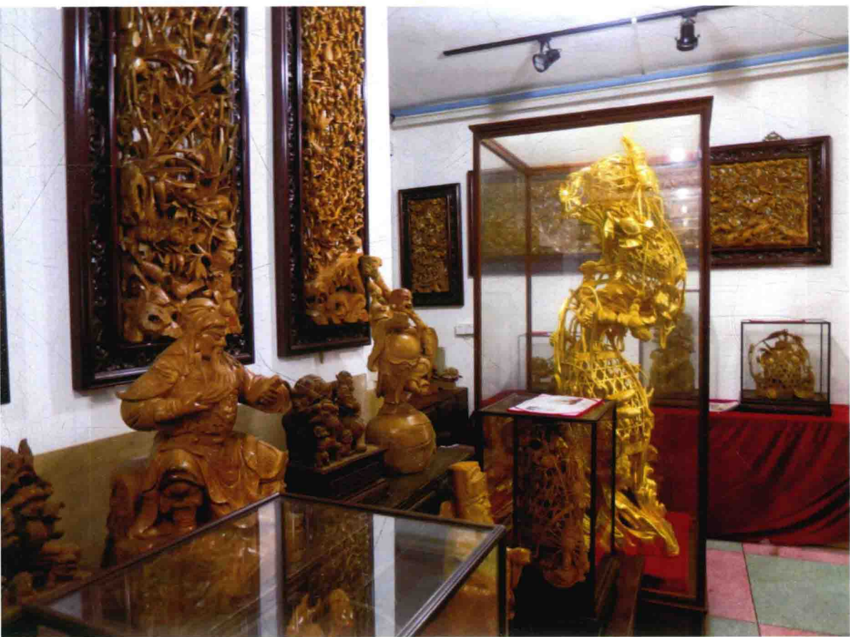
图 12 潮州市金丽木雕研究所陈列室一瞥