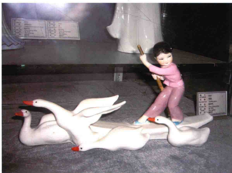
图4 陈钟鸣瓷塑作品《牧鹅》（摄影：王德春）