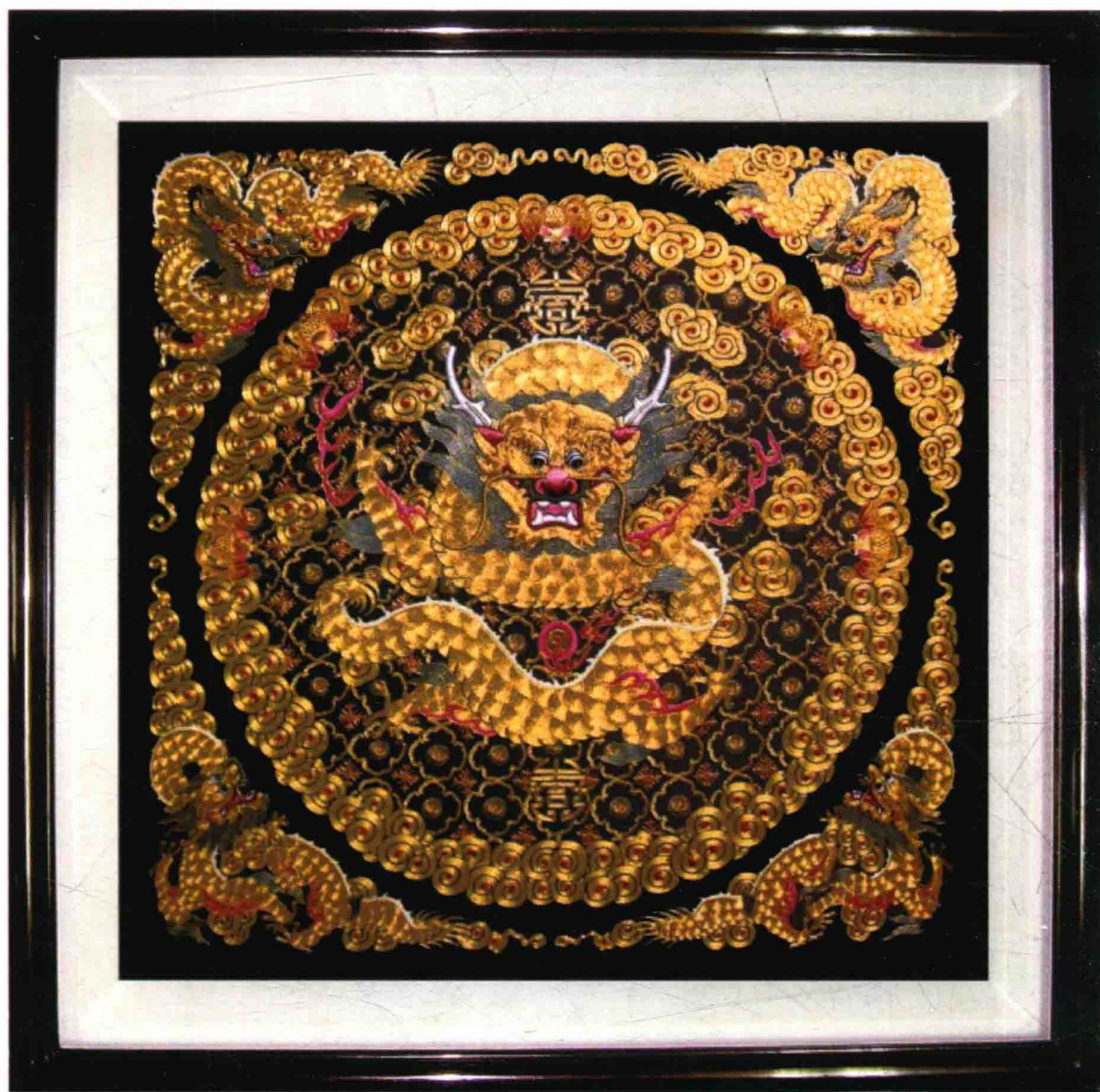
图 11 康惠芳大师潮绣作品：《仿古五龙图》