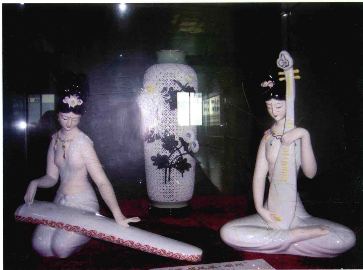
图2 陈钟鸣瓷塑作品《知音》