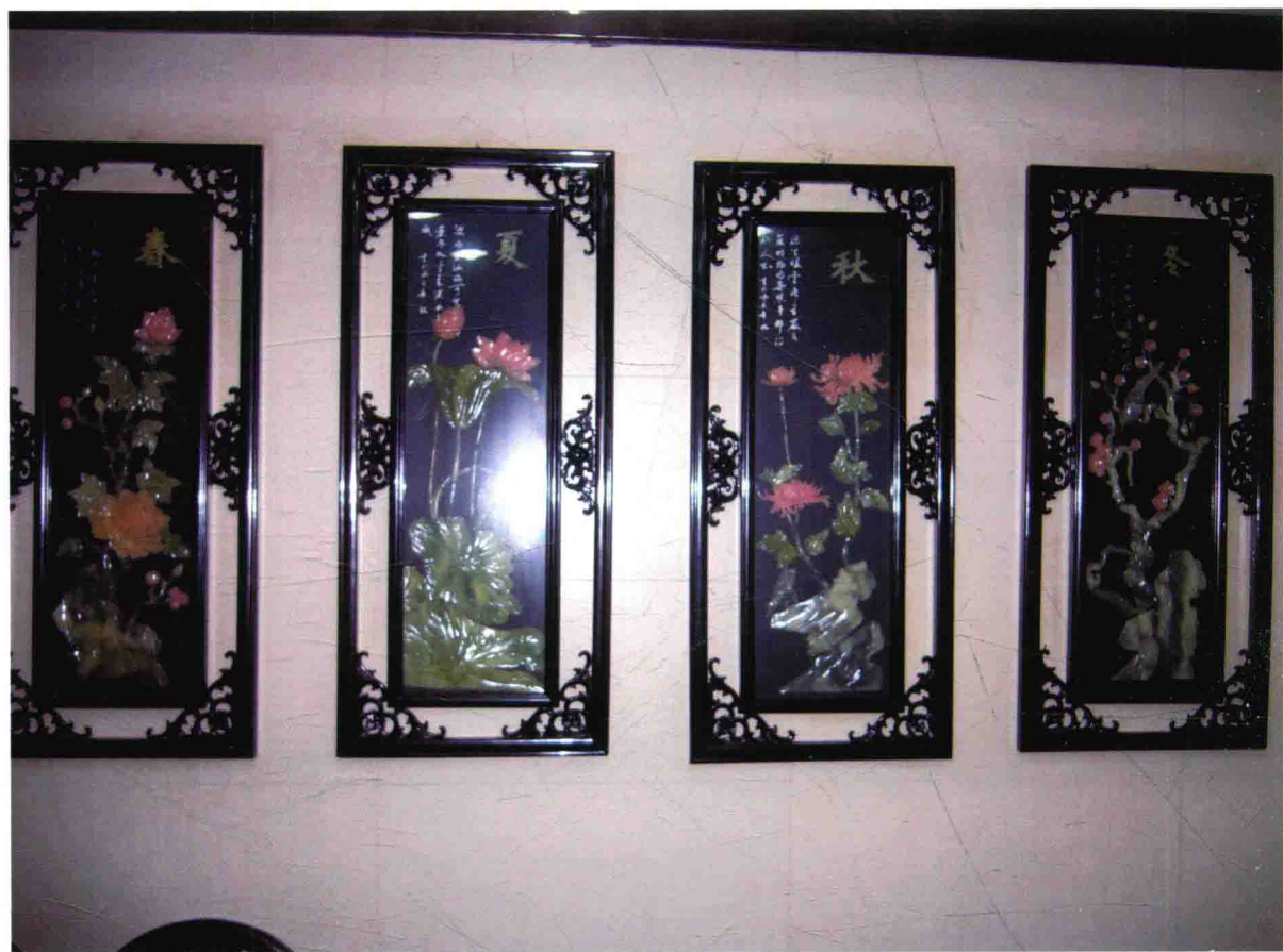
图5 瓷板彩塑《四季花开》