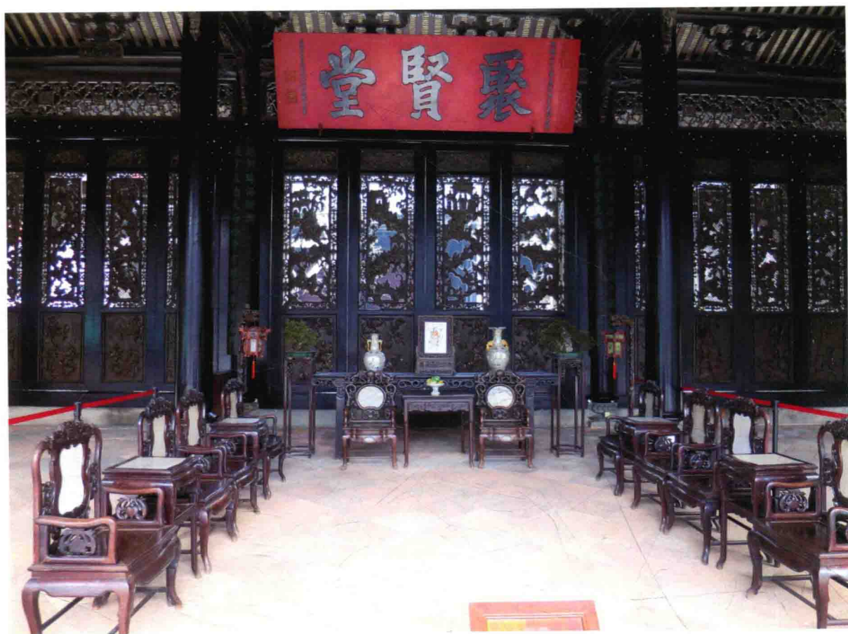
图 13 广州陈家祠“聚贤堂”木雕装饰 ①