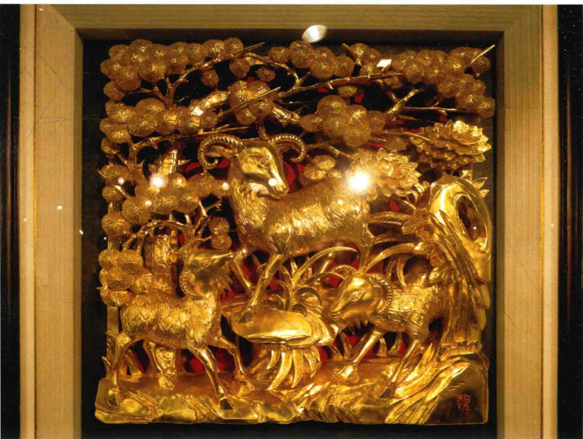
图 14 潮州金漆木雕作品《三羊开泰》