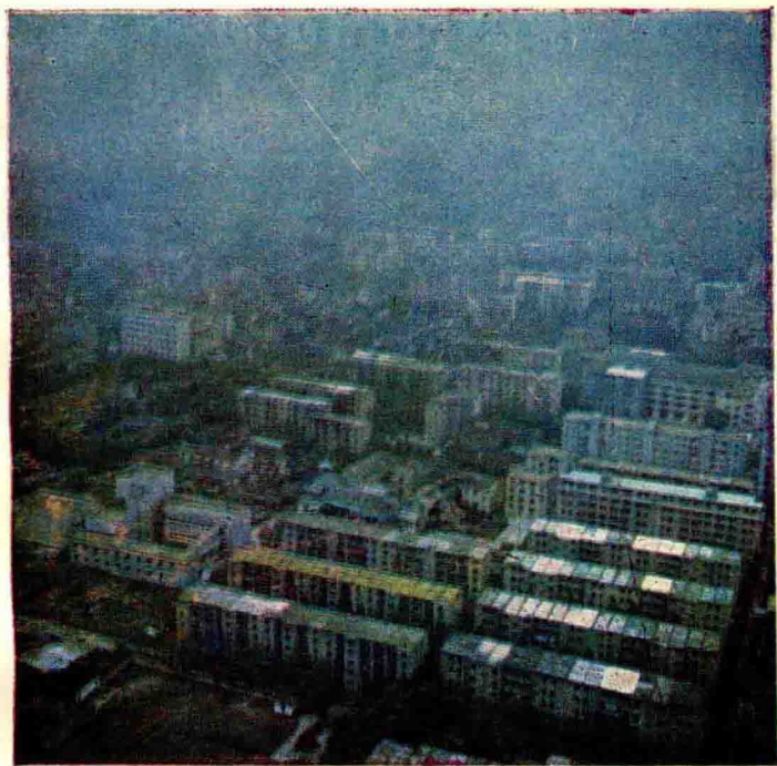
嘉定鸟瞰图