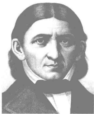
图 1-2 福禄倍尔

学前教育学成为一门独立的学科最先是由德国教育家福禄倍尔(F. Frobel, 1782—1852,如图1-2所示)提出的。他开始受到了夸美纽斯和法国启蒙思想家卢梭的影响,后来又接受了瑞士教育家裴斯泰洛齐的儿童教育思想。于1837年在德国的勃兰根堡创设了一所收托1~7岁儿童的教育机构,1840年命名为幼儿园(Kindergarten),这是世界上第一所幼儿园。他的主要著作有《人的教育》(1826)《慈母游戏和儿歌》(1843)。其中,1861年出版的《幼儿园教育学》是世界上第一本以幼儿园教育学命名的著作,成为学前教育学独立的标志。