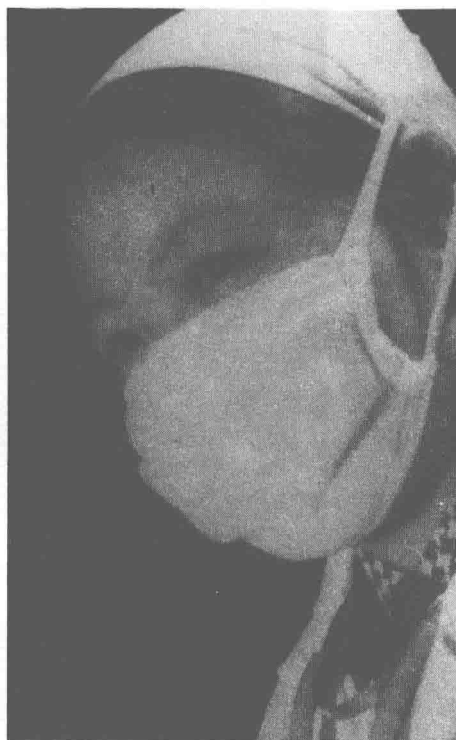
池莉 第一个职业是流行病医生